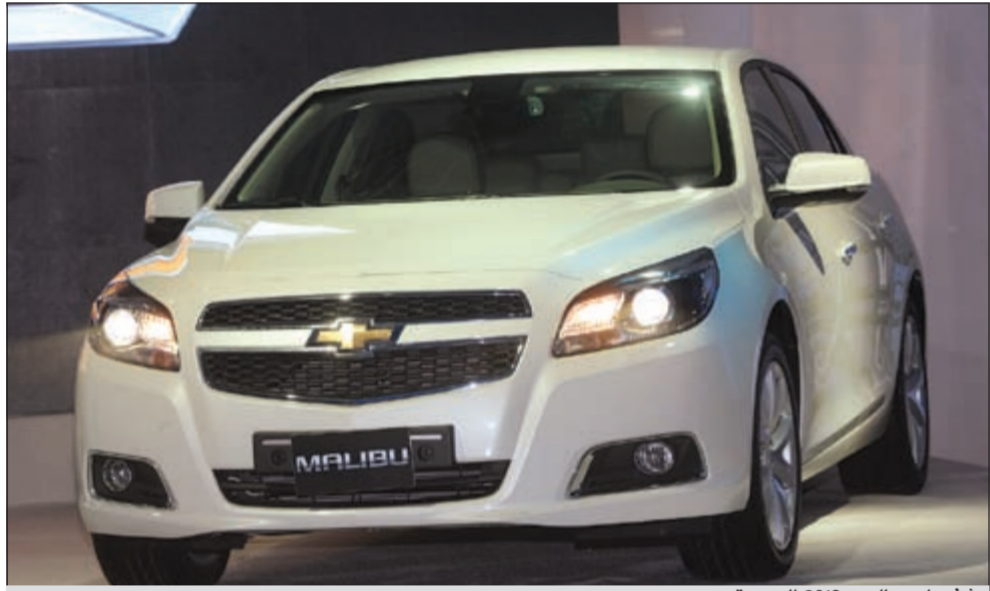
شفروليه ماليبو 2013 الجديدة