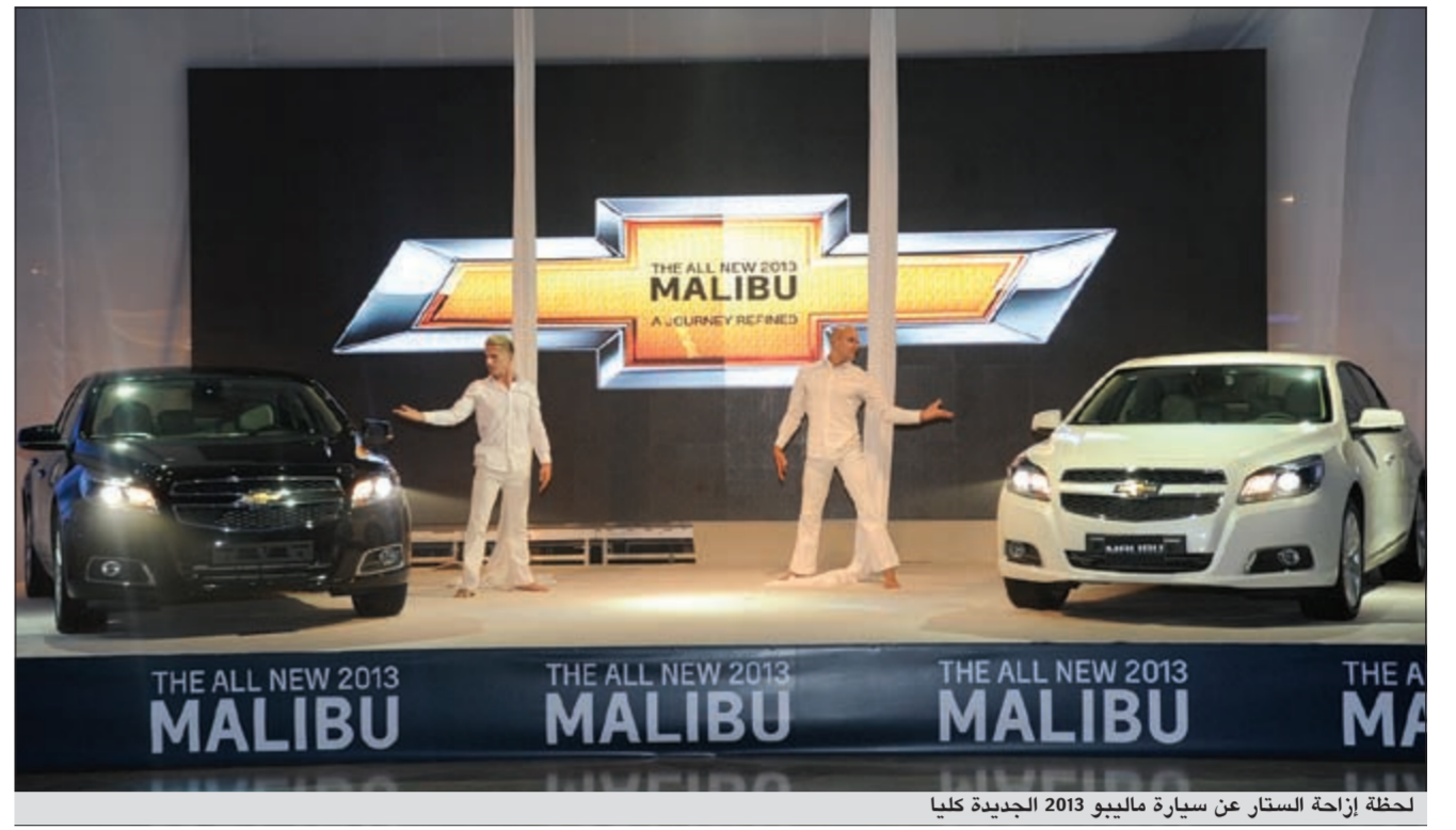
لحظة إزاحة الستار عن سيارة ماليبو 2013 الجديدة كلياً

جذابة بتصميمها الخارجي وفريدة بمقصورتها الداخلية