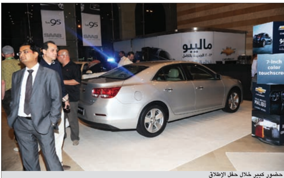
حضور كبير خلال حفل الإطلاق