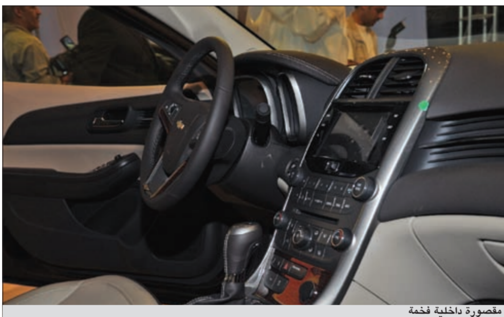
مقصورة داخلية فخمة