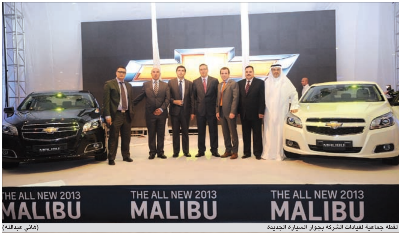
لقطة جماعية لقيادات الشركة بجوار السيارة الجديدة (ماني عبدالله)