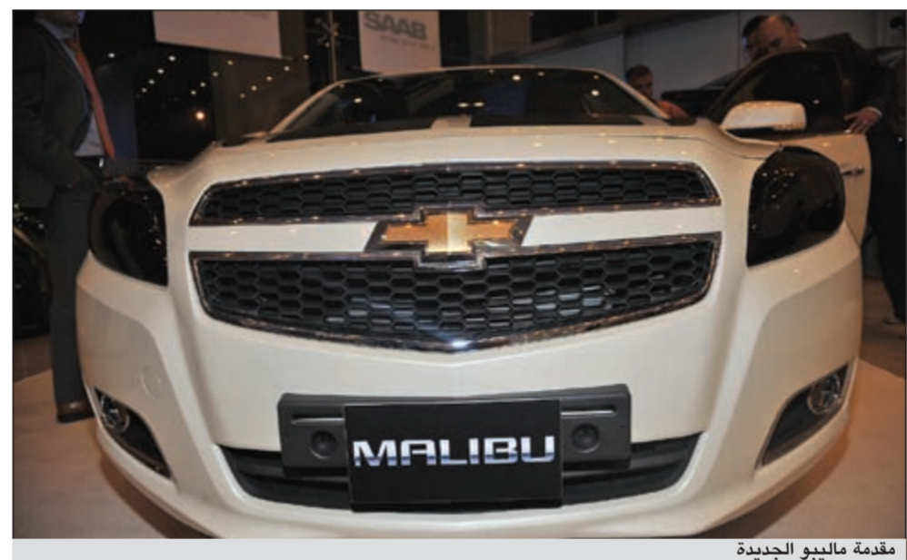
مقدمة ماليبو الجديدة