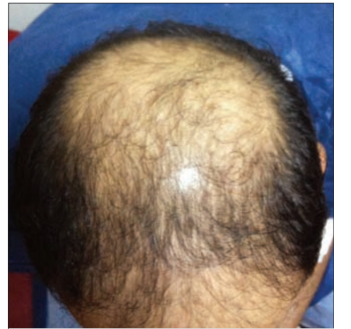
استرداد الشعر بعد العلاج الكيميائي