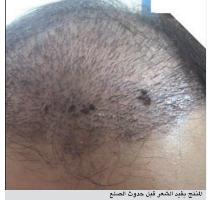
المنتج يفيد الشعر قبل حدوث الصلع