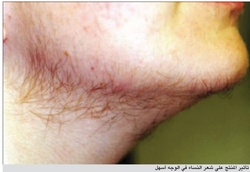
تأثير المنتج على شعر النساء في الوجه أسهل

دون حساسية هل سبق ان سبب المنتج أي حالات حساسية أو مضاعفات أو عوارض غير مرغوب فيها؟ ● من خلال خبرتي، فهو لم يسبب أي حساسية أو عوارض، لأنه يعتبر منتجاً طبيعياً وهذا في معظم الحالات ولكن أي منتج على وجه الأرض، ولو بنسبة ضئيلة احتمال ان يسبب