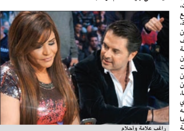
راغب علامة وأحلام

بالرغم من انتهاء برنامج «أراب أيدول» والعمل على الجزء الثاني منه، فإن المشاكل والردود لم تنته بين الفنان راغب علامة والفنانة أحلام، حيث قال راغب: عندما طرح علي اسم أحلام للمشاركة في لجنة تحكيم برنامج «أراب أيدول»، وافقت رغم معرفتي بوجود إشكال حول شخصيتها، فانا أحب التعامل مع هذا النوع من الشخصيات، لأنني إذا أردت التعامل مع امرأة، أحب أن أذكر بأنها امرأة، كما أنني وافقت على اعتبار أن راغب في حديثه له مع مجلة «سيدتي»: خلال سفرنا للبلدان العربية اكتشفت أن أحلام ليست معروفة بهذا القدر إلا في بلدان الخليج، وإنما ما ان تخرج عن هذا المحيط حتى تنحسر شهرتها، ومع ذلك استمر البرنامج الذي يفترض ان تكون سعيدة بنجاحه وبالشهرة التي حصدتها عربيا من خلاله، واستنظر راغب علامة