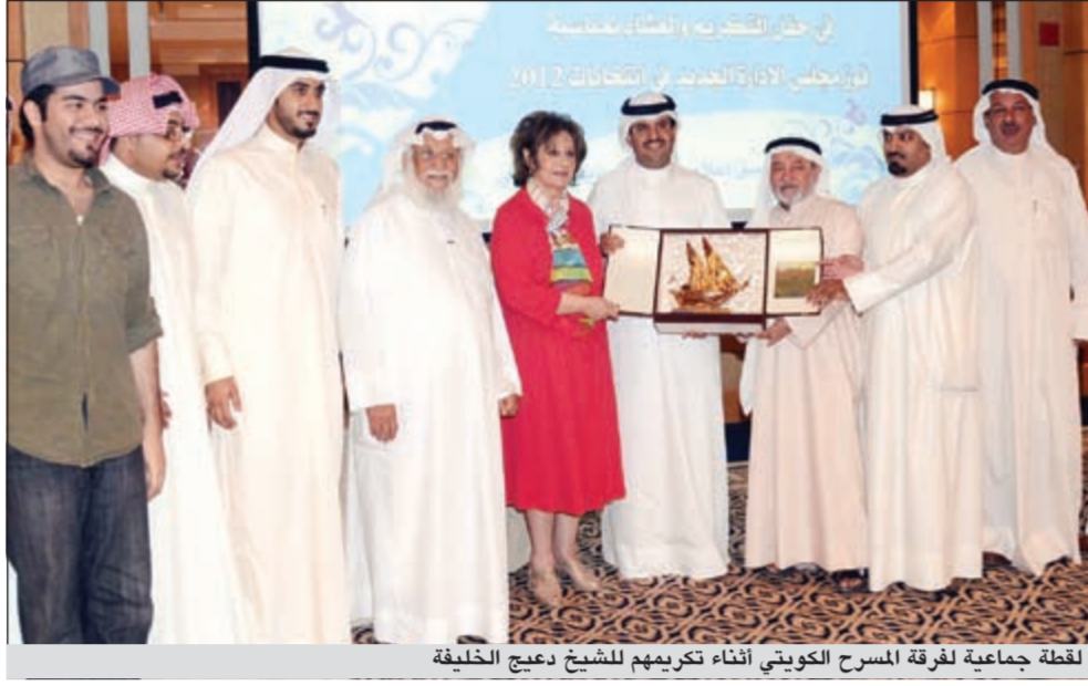
لقطة جماعية لفرقة المسرح الكويتي أثناء تكريمهم للمشيخ دعيج الخليفة