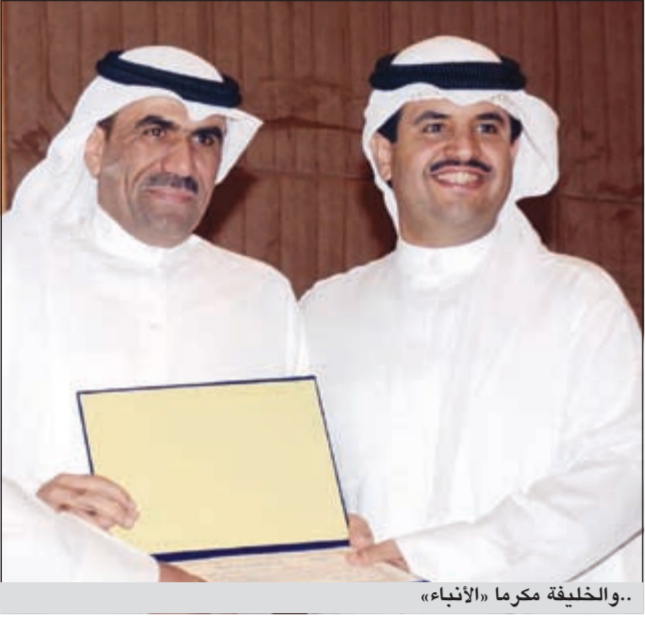
..والخليفة مكرما «الأنباء»