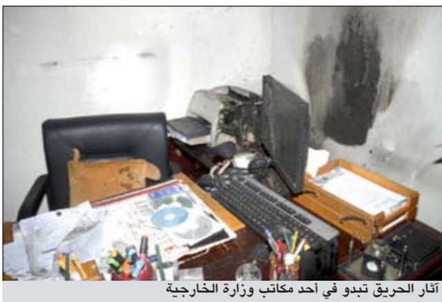
أثار الحريق تبدو في أحد مكاتب وزارة الخارجية