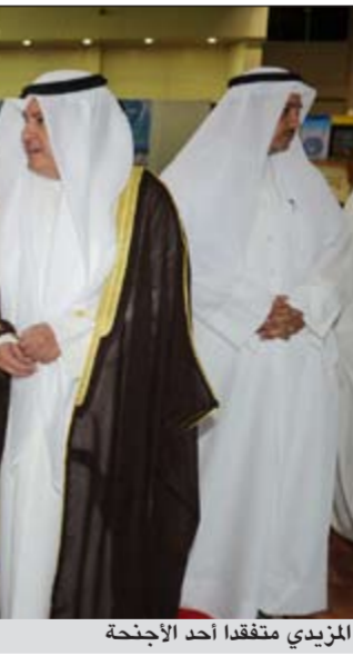
جناح شركة المشروعات السياحية

اعتبر وزير المواصلات سالم الأذينة أن صناعة السياحة والسفر فن علمي وراقي يلعب دوراً كبيراً في إنعاش اقتصادات الدول وزيادة مدخولها من خلال توسيع قاعدة استثماراتها التشغيلية في مجال الخدمات السياحية وأصبحت شركات السياحة والسفر والفنادق العاملة في هذا المجال في المنطقة تنافس في تقديم عروضها وخدماتها وبأسعار تشجيعية ما يفسح المجال لإنشغال روح التنافس في توفير أفضل الخدمات السياحية والفندقية لاقتناص المزيد من العملاء. وفي كلمة وزعت على الصحافيين خلال افتتاح معرض عالم السفر من قبه الوكيل المساعد للشؤون القانونية في وزارة المواصلات عبد المحسن المطيري اعتبر الأذينة أن هذا المعرض أصبح معلماً وسوقاً