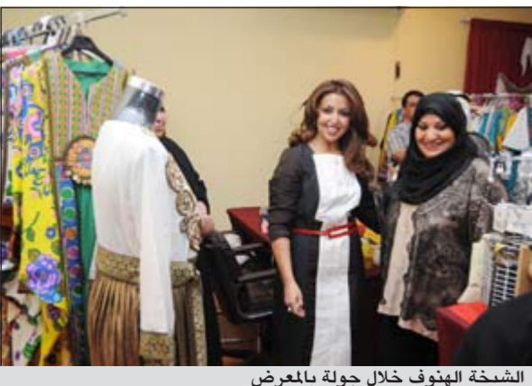
الشيخة الهنوف خلال جولة بالمعرض

تحت رعاية وحضور الشبيخة الهنوف بدر محمد الصباح افتتحت رابطة الاجتماعيين معرض «حرف يدوية.. بأياد كويتية»، وذلك مساء أول من أمس بمشاركة عشرات المهتمين الذين قدموا منتجاتهم الخاصة في المعرض الذي يستمر ثلاثة أيام. وخلال جولتها في المعرض بصحبة عدد من مسؤولي الرابطة وحشد من الجمهور من بينهم زوجات دبلوماسيين أبدت الشبيخة الهنوف إعجابها بما شاهدته في المعرض، معتبرة أن مثل هذه المعارض تبرز المواهب الكويتية في مختلف المجالات، خاصة أن المعرض يضم عشرات الأركان التي خصصت لمعرضات منتجات كويتية متنوعة بين مغشولات يدوية ونشاطات متنوعة خاصة بربضان وأخرى مخصصة بالوجبات لأنشطة غذائية مميزة. وأعربت الشبيخة الهنوف عن استعدادها لأن تساهم في دعم رابطة الاجتماعيين في أنشطتها بمثل هذه المجالات التي تبرز المواهب الكويتية خاصة أنها بمثابة حلقة وصل بين المبدعين الكويتيين في مختلف الأنشطة والجمهور الذي يأتي ليتعرف على ابداعات الشباب الكويتي من الجنسين.