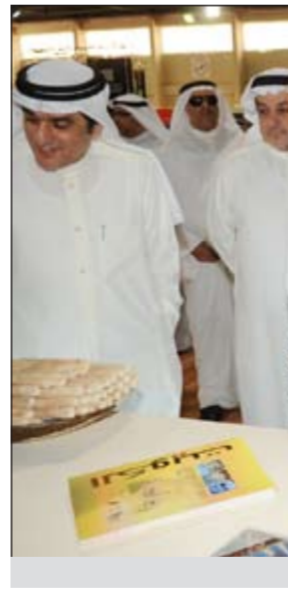
المزديدي متفقاً أحد الأجنحة

سنويا تشد إليه الرحال في كل صيف من قبل الزائرين، وأن هذا المعرض ما هو إلا احدي الأدوات التي يمكن الاعتماد عليها للوصول إلى مقاييس قريبة من الحقيقة لرصد واقع وحجم الخدمات المقدمة في هذا القطاع ومعرفة الصعوبات التي تواجه العاملين فيه. وقال انه إيماناً بهذا الدور وأهميته تم توفير جميع المعلومات والخدمات السياحية باعتبار أنها تمثل الوجه الحضاري للكويت وحلقة الوصل مع كل الجهات التي يطل من خلالها العالم على الكويت وما أنجزته من تقدم وتطور ملحوظ للقطاع بربك الحضارة. من جانبه، قال رئيس مجلس