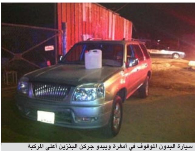
سيارة البجون الموقوف في أمفرة ويبدو جرحن البنزين أعلى المركبة

قال مصدر أمني ان رجال إدارة بحث وتحري محافظة الجهراء بصدد اخضاع شباب من غير محددى الجنسية لتحقيق مكثف بعد اشتباخ آثار المواد المخدرة من دمه، حيث كان في حالة يرثى لها جراء احتسانه كمية من المواد المسكرة، وكان مدير أمن الجهراء اللواء ابراهيم الطراح شكل فرقتين وتكثرت الفرقتان من ضبط بدون كان في منطقة سكراب أمفرة فجراً وتبين ان سيارة كان يستقلها بها اثار بنزين، كما تبين انه يحوز «جركن»، به مادة البنزين، واطاف المصدر من خلال التحقيقات الأولية فان الموقوف تبين عدم وجود اي