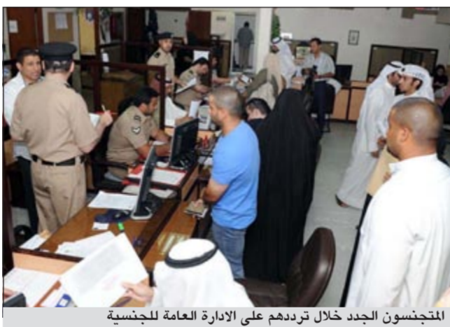
المتجنسون الجدد خلال تردهم على الإدارة العامة للجنسية

العامة للهجرة لإلغاء إقاماتهم الموجودة بالحاسوب نظراً لكونهم تم تسجيلهم كمواطنين حيث سيتم تسليم هؤلاء جنسياتهم صباح اليوم الإثنين. وعن إضافة الزوجة والأبناء قال العقيد الحقان حال تسلمه جنسيته سيمنحه إضافة أبنائه القصر لملف الجنسية وباستطاعته تقديم إعلان رغبة لزوجته للحصول على الجنسية بعد اتمام عام على إعلان الرغبة. وحول استخراج جوازات السفر قال يستطيع المتجنس استخراج جوازات سفر له ولأبنائه حال استخراج الجنسية. وهنا العقيد الحقان المتجنسين بصدر المرسوم الأميري لتجنيسهم داعياً