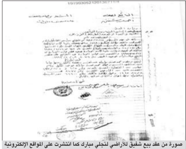
صورة من عقد بيع شفيق للأراضي لنجلي مبارك كما انتشرت على المواقع الإلكترونية

وعلق بيان الحملة: «لو كان النائب الذي ادعى على الفريق شفيق باتهامات باطلة -بحاسب عليها القانون- قد استهدف الصالح العام لكان قد ذهب مباشرة بإبلاغه الى النائب العام بدلاً من تعطيل اعمال مجلس الشعب، لكن ما حدث ثبت بما لا يدع مجالاً للشك ان البرلمان يتدخل في العملية الانتخابية، ويصر على ان يحاول ان يؤثر في ارادة الناخبين في ضوء خشية المجلس والتيارات المسيطرة عليه من تزايد شعبية احمد شفيق». «وأوضح البيان ان الاتهامات التي ساقها النائب باطلة، لانها تتعلق بجمعية مشهورة منذ منتصف السبعينيات، والاراضي التي يتحدث عن انها خصصت من قبل الفريق شفيق، كانت قد خصصت لعلاء وجمال مبارك عام 1989 وقيل ان يترأس احمد شفيق الجمعية بـ 4 سنوات، وهو لم يكشف اسراراً ولكنها عقود موثقة ومشهورة، وتم اقرارها وفقاً لنظام الجمعية المعلن للعاملين في القوات الجوية وعائلاتهم حتى الدرجة الثانية». وذكر البيان ان الفريق احمد