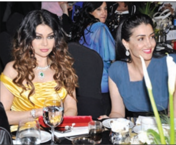
مشهد من مسلسل «سنة أولى جامعة»