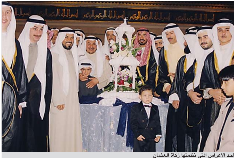
أحد الأعراس التي تظمنها زكاة العثمان

هناك شيخ الطلاق الذي هو الآخر يهدد كيانات أسرية، موضحاً ان العنوسة أصبحت بارزة تؤدي التخزين وتقلق من بعينهم أمر استقرار الحياة الأسرية في بلادنا. ولقت الكندي الى ان اللجنة تسعى الى القضاء على العنوسة وتساهم في التشجيع على الزواج لما فيه من استقرار للفرد والمجتمع ولما فيه من غفان النفس، والتحصين من الشيطان، وغضن البصر وحفظ الفرج، فالفرج سواء كان رجلاً أو امرأة إذا كان دون زواج سيكون هدفاً للنوايا وأكثر تقبلاً للفساد، مشيراً الى ان الزواج فيه تحصين للولد، لإبقاء النسل وحصول الذرية الطبيعية.