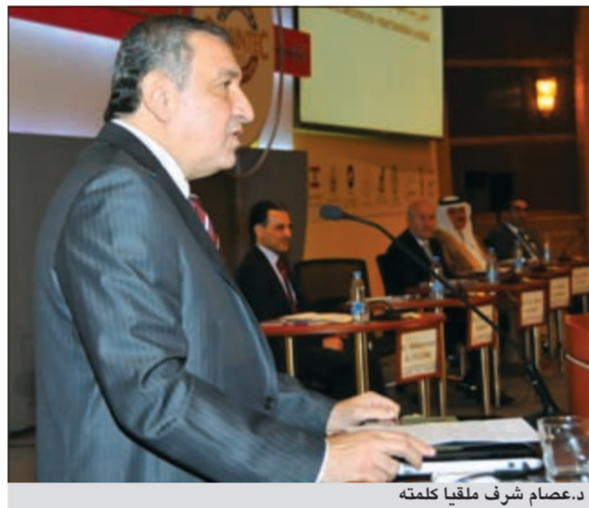
د.عصام شرف ملقياً كلمته

تحقيق مجموعة من الأهداف تتمحور حول ترسيخ التوعية بأهمية الصيانة، وتأسيس دور المعهد كمرجعية عربية مشتركة في مجال الصيانة، وتوسيع التعاون مع الهيئات الدولية لتحقيق نقل الخبرة، وتفعيل برامج التدريب وتقديم الخدمات الاستشارية، وتشجيع الأبحاث والتأليف والترجمة، مؤكداً سعي مجلس المعهد لإشراك الأعضاء العاملين بالمعهد وجميع المختصين في الدول العربية في أنشطته والاندماج في مجموعات وفرق العمل التي ستكون خلايا العمل المشترك. وبين الفوزان بقوله: «إن طموحاتنا كثيرة نحو دفع العمل العربي المشترك لتحقيق