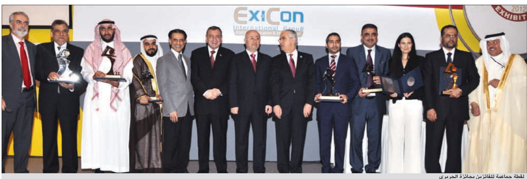
لقطة جماعية للفائزين بجائزة الحريري

استمراراً لتنفيذ خطة عمل المعهد التي أقرت خلال الدورة الماضية 2008-2011، واصلت فرق العمل انشطتها المحددة لكل مجموعة وفقاً للآليات التنفيذية التي وضعتها الأمانة العامة للمعهد. وقد تمثلت أهم الأنشطة والإنجازات التي حققها المعهد خلال الفترة حتى مايو 2012، في الآتي: ● جار التحضير لتوقيع مذكرة تفاهم بالتعاون مع كرسى المعلم محمد بن لادن للتشغيل والصيانة بجامعة طيبة بالمملكة العربية السعودية وذلك في مجال أبحاث ودراسات الصيانة. ● تم إعداد دليل أعضاء المعهد ويجري تنقيحه وطباعته حالياً ليتم تزويد الأعضاء به. ● تم تحديث الكتيب التعريفي للمعهد وإعداد نسخ إلكترونية وذلك لاستخدامها في عملية توسيع التعريف بالمعهد لدى الهيئات والجهات الهندسية والتقنية بالدول العربية. ● جار وضع المسامات النهائية على موقع للتشغيل والصيانة متكاملة للمعهد العربي للتشغيل والصيانة. ● تم وضع تصور وإستراتيجية للبرامج التدريبية ويجري مراجعتها لإقرارها من مجلس المعهد. ● المشاركة مع شعبة هندسة التشغيل والصيانة بالهيئة السعودية للمهندسين