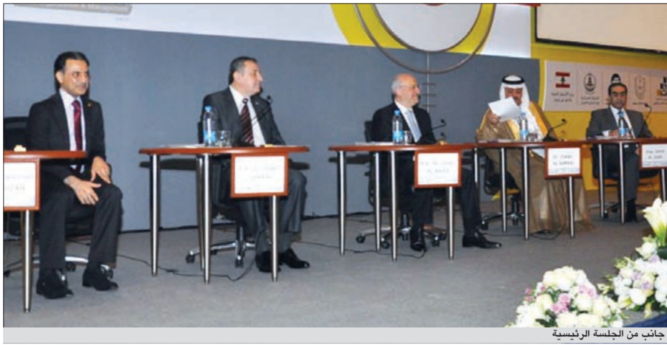
جانب من الجلسة الرئيسية