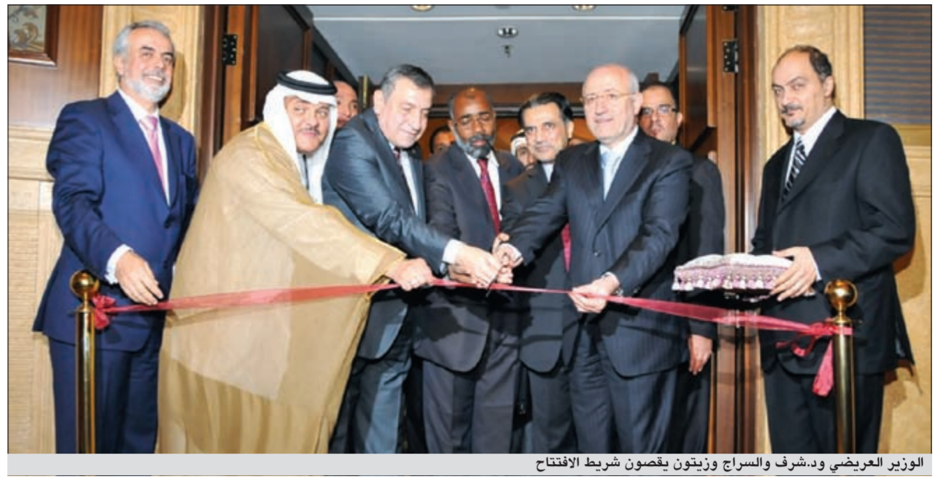
الوزير العريضي و د.شرف والسراج وزيتون يقصون شريط الافتتاح