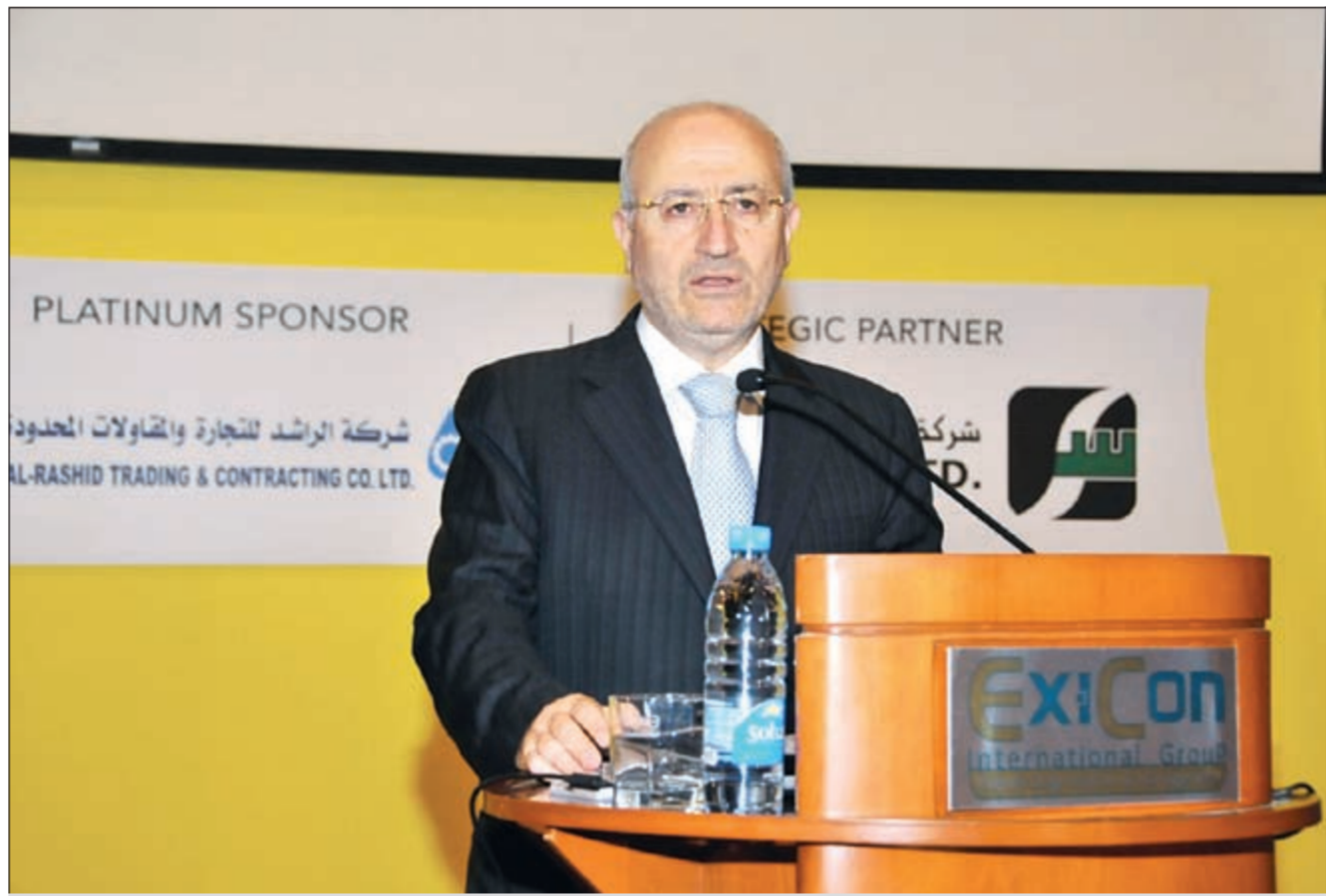
الوزير غازي العريضي أثناء إلقاء كلمته في حفل الافتتاح ممثلاً للرئيس اللبناني

والدعوة مفتوحة للجمهور». وأضاف قائلاً: «إنه من الواضح أن هذا النجاح للملتقى لم يأت إلا بجهود كبيرة من المعهد العربي للتشغيل والصيانة والأمانة العامة واللجان المنظمة واللجان العلمية، فلهذا كل الشكر والتقدير، مؤكداً على الاستمرار بزخم تصاعدي وما كان غياب الملتقى العام الماضي بسبب الربيع العربي إلا لتأكيد على المحافظة على المستوى المتطور للبرنامج العلمي». وفي ختام كلمته، كرر زيتون الشكر والتقدير للرئيس اللبناني العماد ميشال سليمان لغضله برعاية هذا الملتقى، ولضيف شرف الملتقى رئيس وزراء مصر السابق د. عصام شرف، والوزير غازي العريضي لتعاونه المميز»، مشيراً إلى أن الشكر موصول لكافة الجهات الداعمة والرعاية لهذا الملتقى.