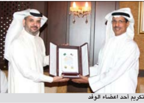
تكريم أحد أعضاء الوفد