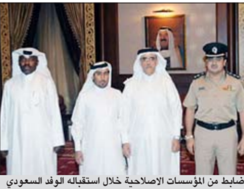
ضباط من المؤسسات الإصلاحية خلال استقباله الوفد السعودي

وصلت الى البلاد مساء أمس الاول الوفود الخليجية المشاركة في الاجتماع التاسع عشر لمسؤولي المؤسسات العقابية والإصلاحية والاجتماع المشترك لمسؤولي المؤسسات العقابية والإصلاحية ولجنة الإعلام الأمني لاختيار اسم أسبوع التزليل وموضوعه بدول مجلس التعاون لدول الخليج العربية الذي تستضيفه الكويت خلال الفترة من 13 الى 16/5/2012 حيث وصل وفد كل من (المملكة العربية السعودية الشقيقة ودولة قطر والشقيقة). وهذا وتكتمل وصول الوفود الخليجية اليوم وغداً على ان يبدأ الاجتماع التنسيقي بين مسؤولي المؤسسات العقابية والإصلاحية ولجنة الإعلام الأمني لاختيار اسم أسبوع التزليل وموضوعه بدول مجلس التعاون لدول الخليج العربية، وتتبعه الجلسة الافتتاحية صباح يوم الاثنين.