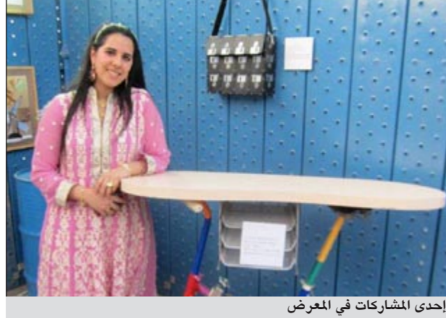
إحدى المشاركات في المعرض