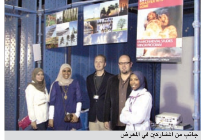
جانب من المشاركين في المعرض