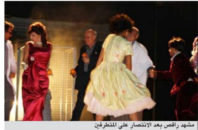
مشهد راقص بعد الانتصار على المتطرفين