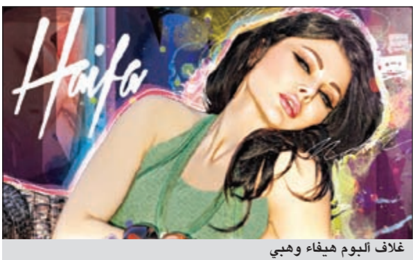
غلاف الألبوم هيفاء وهي

طرحت شركة روتانا الثلاثاء الماضي اليوم الفنانة هيفاء وهي المنتظر «JK»، ومنذ إصداره احتل الألبوم الذي هو من إنتاج شركة روتانا للصوريات، المرتبة الخامسة على لائحة الإصدارات العالمية على الـ iTunes وهذا ما يعد سابقة وتميزاً للألبوم عربي. وكانت «روتانا» قد استغلت إصدار هذا الألبوم بجملة إعلانية مبتكرة وضخمة بحيث كانت السباق في العالم العربي بطرح اليوم الفنانة هيفاء وهي على الـ iTunes، وبإطلاق حملة ترويجية غير مسبوقه عبر وسائل التواصل الاجتماعي منها الفيسبوك والتويتز، كما خصت الشركة الألبوم بحملة إعلامية ضخمة عبر الإعلام المرئي والمسوع، بالإضافة إلى حملة إعلانية خارجية واسعة غطت المدن العربية. أيضاً، ولمرة