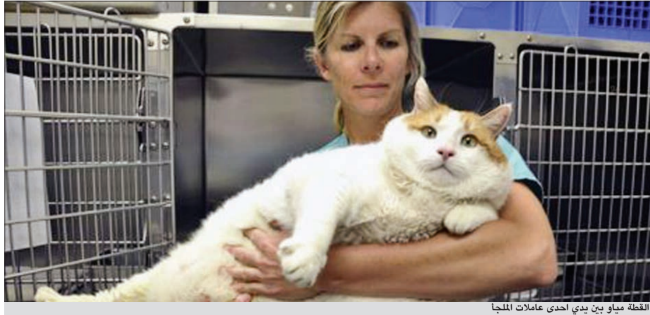
القطة مياو بين يدي إحدى عاملات المبدأ

انتقلت الى ماوى سانتا في جمعية الرفق بالحيوان الشهر الماضي، بعدما عجز مالكاها البالغ من العمر 87 عاما عن رعايتها. وقام الماوى بإخضاع القطة الى حمية غذائية، ونجحت القطة بالفعل في خسارة رطلين عندما بدأت تعاني مشاكل في التنفس يوم الأربعاء الماضي، وعلى الرغم من الجهود الحقيقية التي يبذلها الماوى الا ان القطة توفيت مساء السبت الماضي.