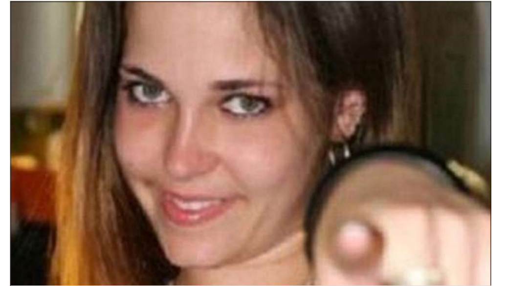
إحدى السجينات الجميلات

أوجدت السجون الأميركية طريقة مثلى لسد الفجوة بين السجناء والمجتمع خارج السجن، حيث أطلقت موقعا للتعارف مع السجناء.