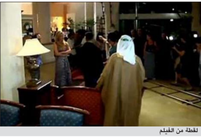
لقطة من الفيلم

وبحسبما نشر موقع صحيفة «يديعوت احروثوت» فإن الحسنة الإسرائيلية التي أسرت قلوب معجبيها من خلال عروض الأزياء الجريئة التي ظهرت فيها، فيجب توخي الحذر منها لأنها أصبحت عملية لجهاز «الموساد» الاسرائيلي، من خلال تقمصها لدور في هذا الفيلم الذي يجري تصويره في مدينة ابيلات. بار رافائيلي ستظهر في الفيلم كإسرائيلية تحت اسم عينا شورتس والتي تخدم