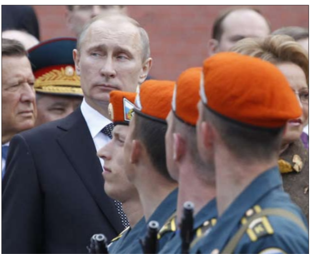
الرئيس الروسي فلاديمير بوتين مستعرضا أفرادا من جنود القوات الروسية عشية احتفالات يوم النصر (رويترز)

واتهم نافالني والقوة لفرص القانون وحماية بالمشاركة في مظاهرة من دون تصريح وصرر أمر بفضولها أمام القضاء يوم الجمعة المقبل، قبل أن يفرج عنها. يأتي ذلك بعد القبض على 436 شخصا الأحد الماضي في موسكو خلال مظاهرة مناهضة للحكومة شارك فيها عشرات الآلاف، وأيضا القبض على 120 شخصا في مظاهرة أصغر حجما الإثنين الماضي.