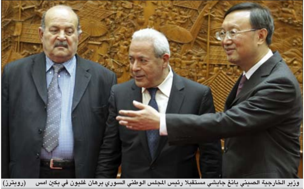
وزير الخارجية الصيني وانغ جياشي مستقبلا رئيس المجلس الوطني السوري برهان غليون في بكين أمس

عواصم - وكالات: وسط ترقب السوريين لتناجس الانتخابات التشريعية التي جرت أمس الأول، برزت مجموعة من التصريحات السياسية اللافتة أمس والتي توقف عندها مجموعة من المحللين والمراقبين.