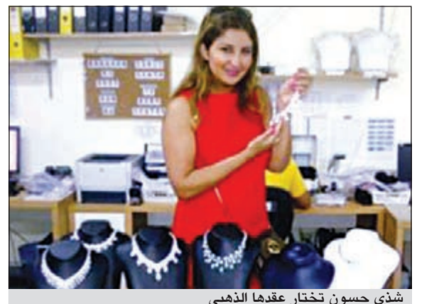
شذى حسون تختار عقدها الذهبي

طلبت المطربة العراقية شذى حسون من جمهورها، على حسابها الخاص بوقع «تويتر»، مشاركتها في اختيار عقدها الذهبي الجديد الذي تنوي شراءه، ووضعت صورة تحتوي على أكثر من تصميم، وطلبت منهم اختيار أفضلهم لشراؤه. وقالت، في تعليق كتته لجمهورها من داخل المحل الذي ذهبت للشراء منه: «ما الشكل الذي تفضله؟.. برجاء الرد الآن». ولم تحسم ردود الإفعال التي استقبلتها شذى حيرتها، فقد حسنت كل التعليقات مؤكدة أن كل التصميمات رائعة، وأن جميعها ستكون لائحة عليها.