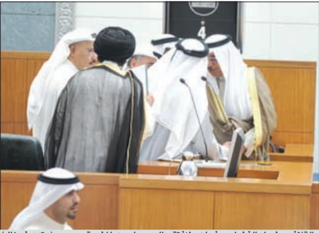
الغلاف ونجيل الفضل يرفعان «لافتة» الجويهل من المنصة (متين غوزال)