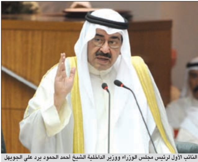
النائب الأول لرئيس مجلس الوزراء ووزير الداخلية الشيخ أحمد الحمود يرد على الجويهل

يحكمته المعهودة وسعة أفقه، تميز في إدارته لجلسة أمس التي تخللها العديد من المشاهد التي يصعب السيطرة عليها. ورغم حالات الاستفزاز العديدة والمتكررة التي تعرض لها السعدون خلال الجلسة، إلا أنه أبى إلا أن يكون رصيناً حليماً واثقاً وتمكن بحكمته وخبرته من تجاوز أحداث الجلسة التي ختمها بتسجيل الشكر للنائب المستجوب على تقديمه للمساعدة وللوزير المستجوب على تعاونه مع المجلس.