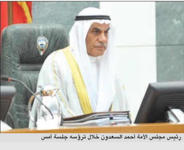
رئيس مجلس الأمة أحمد السعدون خلال ترؤسه جلسة أمس