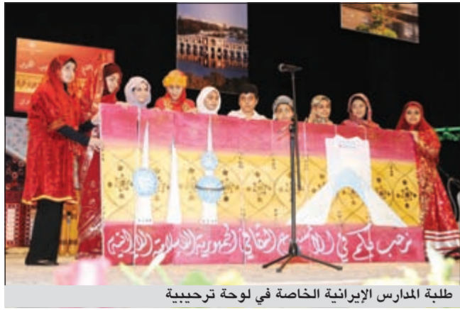
طلبة المدارس الإيرانية الخاصة في لوحة ترحيبية