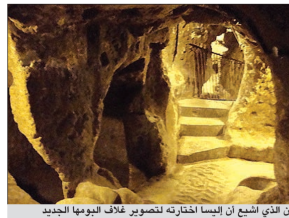
المكان الذي أشيع أن اليسا اختارته لتصوير غلاف البومها الجديد

وسط تضارب الأنباء حول عدم مشاركة أيمن رضا في الجزء التاسع من سلسلة «بقعة ضوء» الشهرية، أكد مصدر من داخل شركة «سوري الدولية» منتجة العمل، بحسب موقع «أنا زهرة»، أن الفنان السوري سيشارك في العديد من اللوحات الكوميدية الاجتماعية في مسلسل «بقعة ضوء». ونفى المصدر ما أوردته وسائل الإعلام المحلية عن عدم مشاركة الفنان السوري بسبب خلاف كبير وقع بينه وبين مخرج المسلسل.