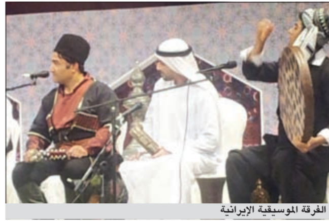
الفرقة الموسيقية الإيرانية