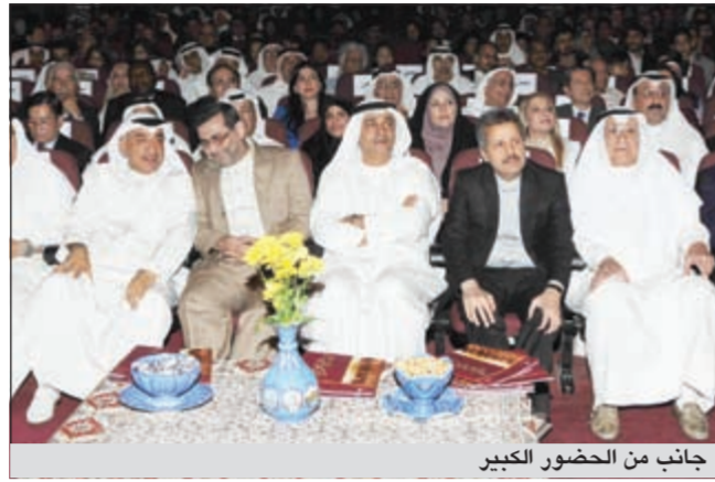
جانب من الحضور الكبير