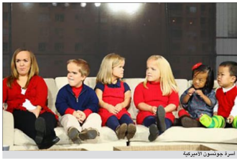
أسرة جونسون الأميركية

ويحمل الأب الذي لديه خمسة أبناء بأسرة كبيرة رغم أنه يعلم أن حالة زوجته الجسدية التي لا