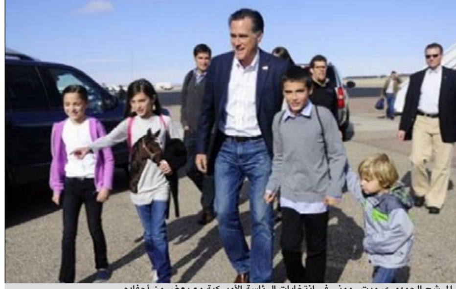
المرشح الجمهوري ميت روموني في انتخابات الرئاسة الأميركية مع بعض من أحفاده

الرئيسي الأمريكي الحالي باراك أوباما (50 عاماً) من حيث عدد «النقاط» في «السباق العائلي»،