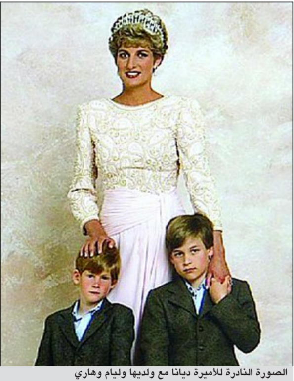
الصورة النادرة للأميرة ديانا مع ولديها وليام وهاري

وقد ظهر الصبيان على عكس والدتهما وهما متجهمان ولكن فيما يبدو كانت لهما أسبابهما