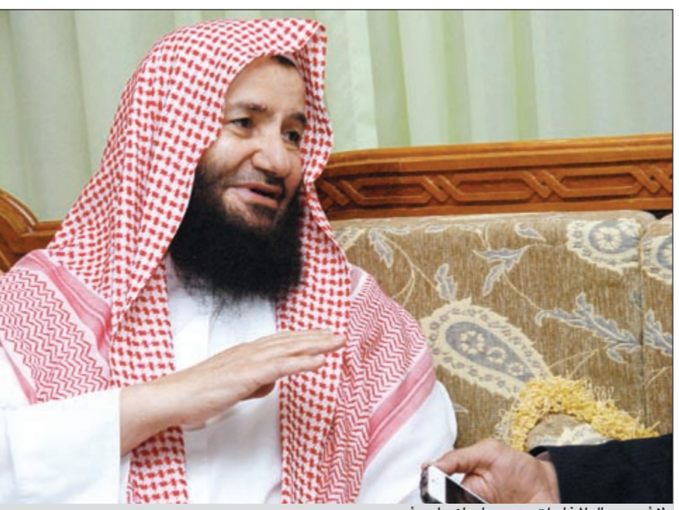
لا أحب رجال المخابرات وعمر سليمان على رأسهم

ولكن من ترى انه الكفا حاليا لقيادة مصر ويمتلك المرحلة؟ ● باسماء بشدة: ما في غير حازم أبوإسماعيل، يحازم يا بلاش. ولكن بعد استبعاده بسبب جنسية والدته هل تعطي صوتك لعبدالمعز البغدادي ام عمرو موسى ام احمد شفيق؟ ● الامور بهذا المسار ربما تسير باتجاه شفيق او عمرو موسى، ونحن ندعو الله ان يختار مصر