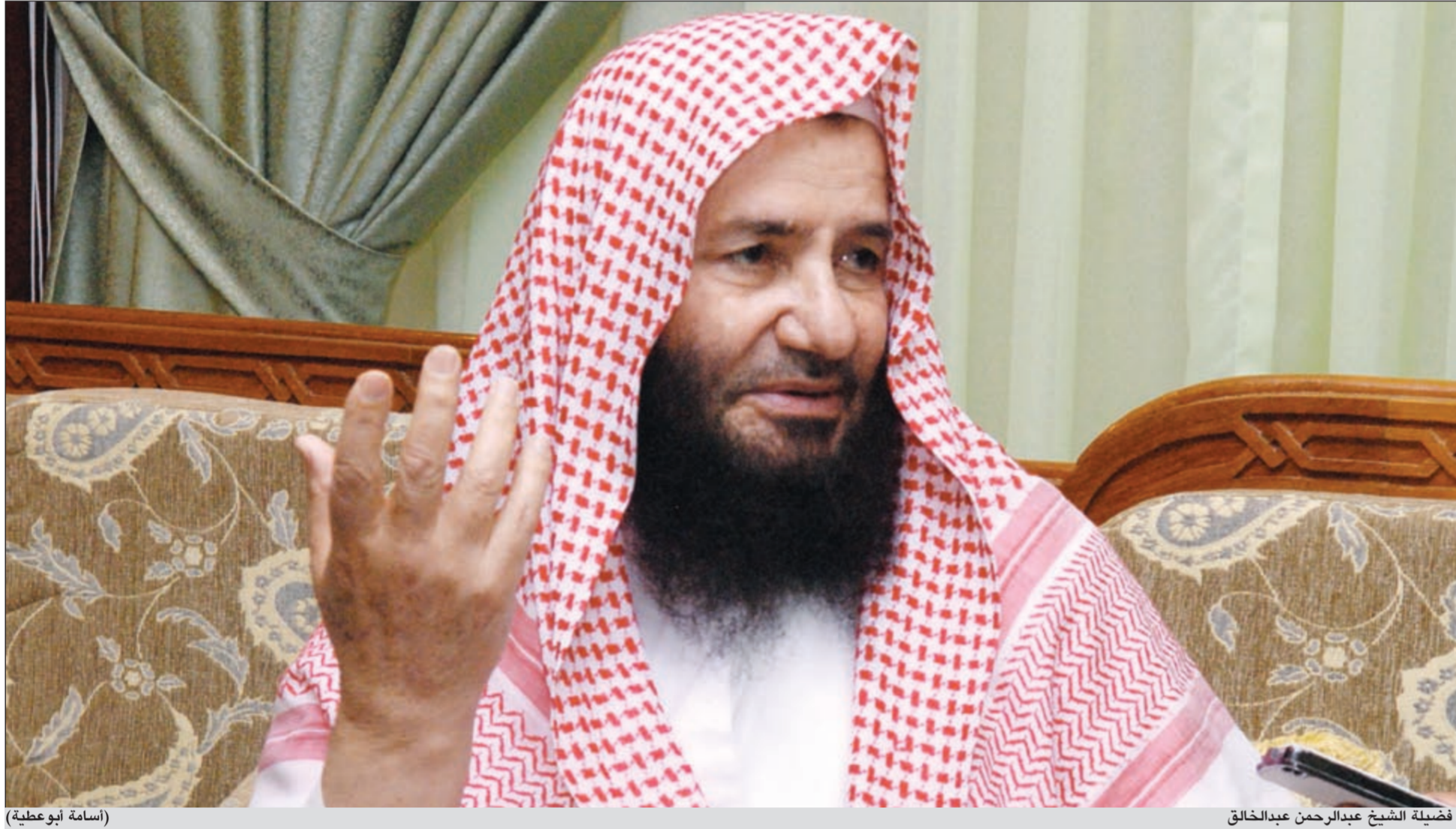
فضيلة الشيخ عبدالرحمن عبدالخالق

فلا ينبغي عليكم ان تقوموا بهذا الامر، فهذا فيه اخلاف للوعد، وهذا ما حدث.