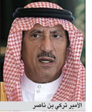
الأمير تركي بن ناصر

الرياض - أ.ش.: أعلن الأمير تركي بن ناصر الرئيس العام للأرصاد وحماية البيئة السعودية ان «جميع الأعمال الإصلاحية والتأهيلية للبيئة البحرية والبرية في السعودية والمتضررة من حرب الخليج ستنتهي في عام 2014م، وستتم