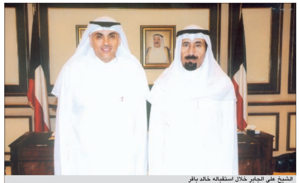
الشيخ علي الجابر خلال استقباله خالد باقر

وصف محافظ العاصمة الشيخ علي الجابر، الحملة التوعوية التي تبثها وزارة الكهرباء والماء لترشيد استهلاك الطاقة الكهربائية والمياه، بالبناءة. وقال المحافظ خلال استقباله الوكيل المساعد في وزارة الكهرباء والماء، خالد باقر إن عملية ترشيد استخدام الكهرباء والماء تبدأ من المنزل ومن الأهل على وجه التحديد. لافتاً إلى أن ثقافة ترشيد الكهرباء والماء، وتجنب الهدر والاستنزاف اللامحدود لهما - يجب أن تسود مجتمعنا وأن نتغلب على هذه الظاهرة، من خلال المسؤولية الملقاة على عاتق كل مواطن والواجب الوطني الذي ينبغي أن يتحلى به، مشيراً إلى أن الفائدة لا تقتصر على الحكومة فحسب بل الاستفادة للمواطن من خلال تقليل فاتورة الاستهلاك الشهري له. من جانبه، ثمن وكيل الوزارة المساعد في وزارة الكهرباء والماء، خالد باقر، الاستجابة السريعة للمحافظ الشيخ علي الجابر لتبني خطة الوزارة في الحملة التوعوية لترشيد الكهرباء والماء، واستخدام الأمل لهما، وتسويقها في الجهات التابعة للمحافظة. وأضاف أن تعزيز دور المحافظات ودعمها يشكل إضافة مهمة لحملتنا، نظراً لأهمية المحافظة في التواصل المستمر مع أبنائها من المواطنين، مشيراً إلى أن نجاح هذه الحملة بحاجة إلى تضافر جميع الجهود الحكومية والخاصة لإنجاحها.