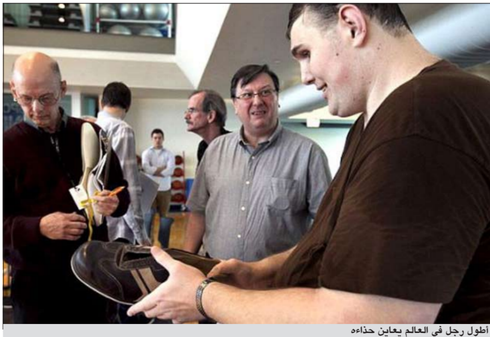
أطول رجل في العالم يعاين حذاءه

إم بي سي: قدمت إحدى الشركات الكبرى في مجال الملابس الرياضية، عرضاً لأطول رجل في أميركا لتقدم له حذاء مصنوعاً له خصيصاً حتى يتمكن من العيش بطريقة طبيعية، وسكلف صنع الحذاء من 12 إلى 20 ألف دولار.