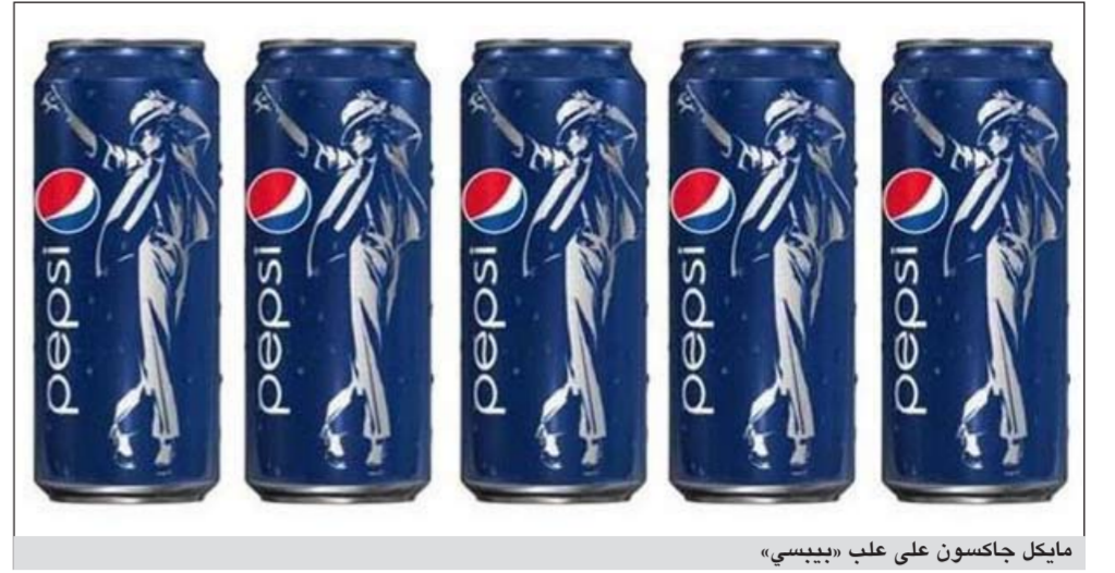
مايكل جاكسون على علب «بيبسي»

ونقل موقع صحيفة «دايلي مايل» البريطانية عن باحثين قولهم أن ممارسة الركض بطريقة معتدلة أفضل من أي رياضة قاسية ومفرطة. وذكرت الدراسة أن الركض بوتيرة بطيئة أو معتدلة لمدة ساعة أو ساعتين في الأسبوع قد يزيد أمد الحياة لدى الرجال بمعدل 6,2 سنوات وعند النساء بمعدل 5,6 سنوات وأن يخفض من خطر الوفاة بنسبة 44٪ وأفاد الموقع بأن هذه النتائج تحض نتائج دراسات سابقة تساءلت عن مدى صحة أو خطورة الركض بالنسبة إلى الأشخاص الذين تقدموا قليلا في السن وذلك جراء وقوع حادثة وفاة لبعض الرجال أثناء ممارستهم لهذه الرياضة.