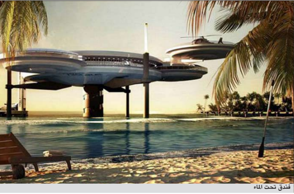
فندق تحت الماء