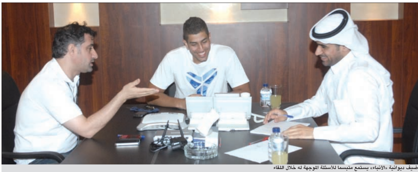
ضيف ديوانية «الأنباء» يستمع متبسما للأسئلة الموجبة له خلال اللقاء