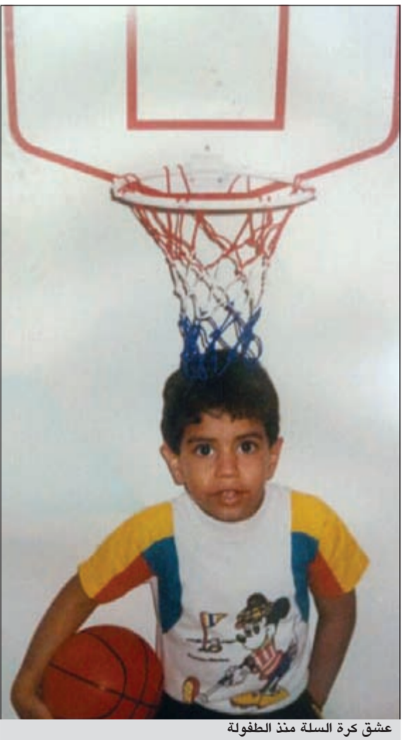
عشق كرة السلة منذ الطفولة

أحرزت 71 نقطة في إحدى المباريات أثناء مشاركتي مع الأهلي البحريني