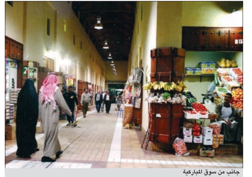
جانب من سوق المباركية

يعتبر سوق المباركية في وسط العاصمة الكويتية بمزلة تحفة تراثية ومعمارية باروقته وازقته التي تحفل بذكريات وحكايات ماضي أهل الكويت حتى أصبح قبلة للمتسوقين الذين تدهشهم فور دخولهم رائحة خليط مركب من الهيل والتوابل العظيمة ممتزجة بروائح «الدخون» والعطور الشرقية. ويتميز السوق وهو أكبر الأسواق الشعبية في البلاد بطابعه التراثي الشعبي من حيث تصميم المحال وأسقفها المكونة من الخشب والجنجل، بأشكال هندسية معظمها مغطاة بـ «العرشان» والجريد المجدول، من سعف النخيل. وقال الباحث في التراث الشعبي الكويتي محمد جمال لـ «كونا» إن سوق المباركية أو أسواق المباركية كما هو متعارف عليه والواقع وسط الكويت العاصمة وتحديداً في منطقة القبلة سمي بذلك نسبة إلى حاكم الكويت الراحل الشيخ مبارك الصباح ويعد من أهم معالم البلاد التراثية.