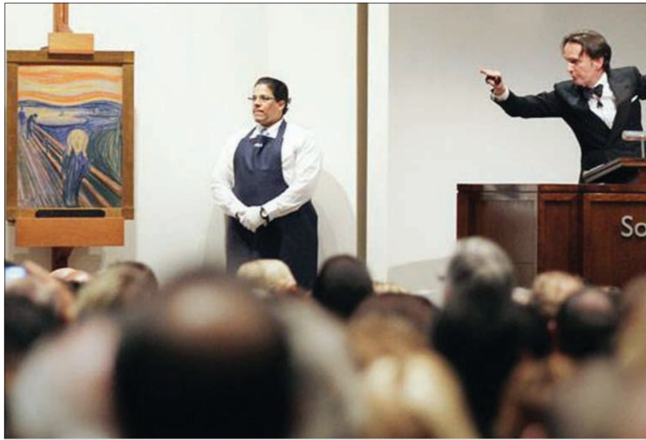
مزاد على «صرخة مونك»