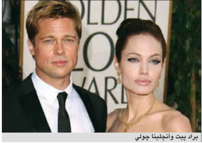
براد بيت وأنجلينا جولي

لذلك فإن هذا الاستثمار له معنى بالنسبة لهما. وكان براد بيت وأنجلينا جولي اللذين لديهما ستة أولاد حددا الموعد الرسمي لزفافهما في الحادي عشر من أغسطس