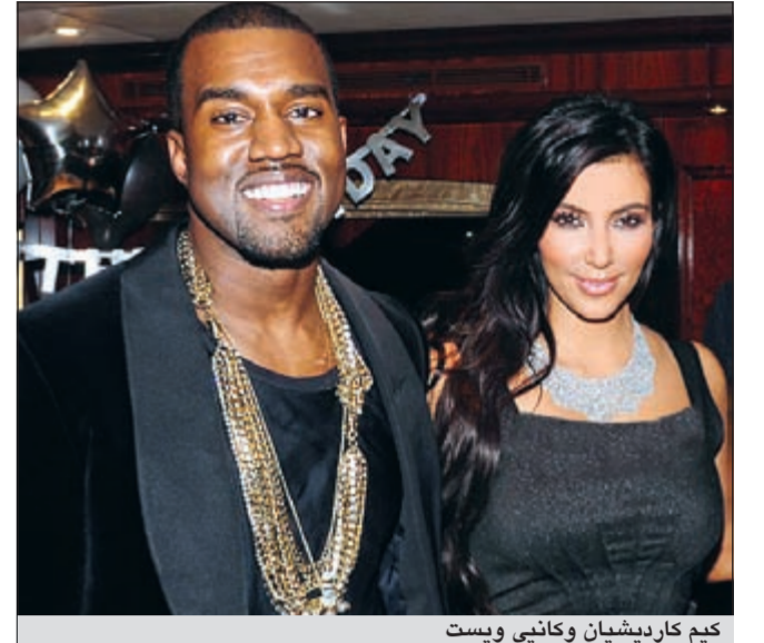
كيم كارديشيان وكاني ويست

وأضاف أن كارديشيان سترافق ويست الحائز جائزة «الغرامي» في جولته الغنائية في الصيف.