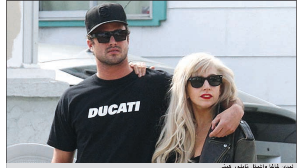
ليدي غاغا والممثل تايلور كيني

لوس أنجلوس - د.ب.أ: انفصلت المغنية الأميركية ليدي غاغا عن الممثل تايلور كيني بطل مسلسل «فامبيير دايريز» (مذكرات مصاصي الدماء). وتردد أن غاغا قررت الانفصال عن كيني للتركيز على مسيرتها الغنائية. وذكرت مجلة «يو أس ويكلي» الأميركية أن غاغا قررت أنه من غير المجدي أن تظل علاقتهما مع كيني في الوقت الذي تريد فيه التركيز على جولتها الغنائية.