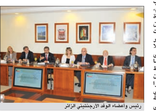
رئيس وأعضاء الوفد الأرجنتيني الزائر

استقبلت غرفة تجارة وصناعة الكويت أمس وزير السياحة الأرجنتيني كارلوس انريكي ميبير والوفد المرافق له الذي يضم 8 أعضاء يمثلون الوزارة وعدداً من الشركات العاملة في مجال السياحة. وتأتي هذه الزيارة على هامش الزيارة الرسمية للوزير الأرجنتيني إلى الكويت، وقد ترأس الجانب الكويتي النائب الثاني لرئيس الغرفة عبدالوهاب الوزان بحضور مدير عام الغرفة رباح الرياح. وفي بداية اللقاء، رحب الوزان بالضيوف الكرام، معرباً عن أمله في زيادة حجم التبادل التجاري من خلال تكثيف تبادل المعلومات المتعلقة بالتجارة والاستثمار والزيارات المتبادلة بين كلا البلدين، خصوصاً على مستوى القطاع الخاص، كما ركز على أهمية وجود خطوط ملاحية مباشرة فيما بين الكويت والأرجنتين، مشيراً إلى أهمية دور الغرفة في تعميم الفرص الاستثمارية المتاحة في الأرجنتين على