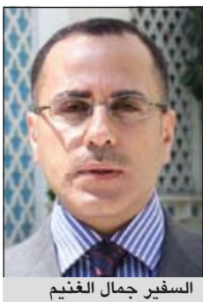
السفير جمال الغني

وقال الغني في تصريح لـ «كونا» ان الاجتماع مخصص لمناقشة الوضع المساوي للأسرى والمعتقلين في سجون الاحتلال الإسرائيلي مع دخول اضراب الآلاف منهم عن الطعام أسبوعهم الثالث. وأضاف انه من المتوقع ان يتوجه الاجتماع الطارئ يطلب الى الجمعية العامة للأمم المتحدة لعقد جلسة استثنائية لمناقشة قضية الأسرى والمعتقلين في سجون الاحتلال وإدراج كيند على أجندة الجمعية العامة للأمم المتحدة. وأوضح ان الاجتماع الطارئ سيناقش أيضاً تنفيذ قرار قمة بغداد الاخير بالتحضير لعقد مؤتمر دولي حول قضية الاسرى الفلسطينيين.