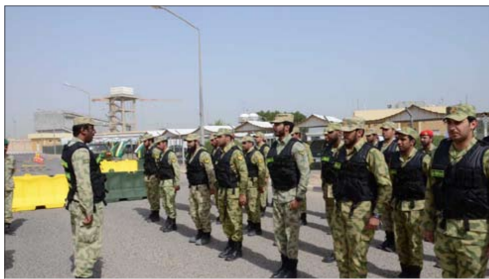
جانب من المشاركين في دورة التفيتش الوقائي

فرع الدفاع الوقائي بتكريم خريجي الدورة والمشاركين في البيان العملي وحظهم على بذل المزيد من الجهد والعطاء لتطوير قدراتهم ليستطيع لهم القيام بالدور المهم الملقى على عاتقهم بتأمين المواقع الحيوية والمهمة في وطننا الغالي في ظل القيادة الحكيمة، حضر حفل التخرج والبيان العملي عدد من قادة وضباط الحرس الوطني.