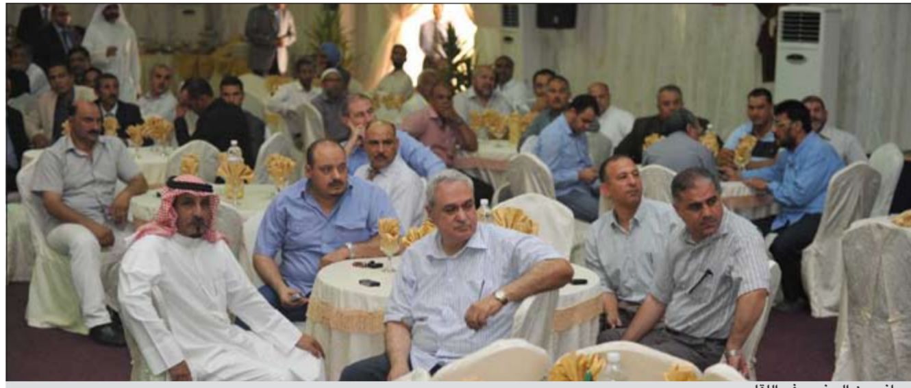
جانب من الحضور في اللقاء