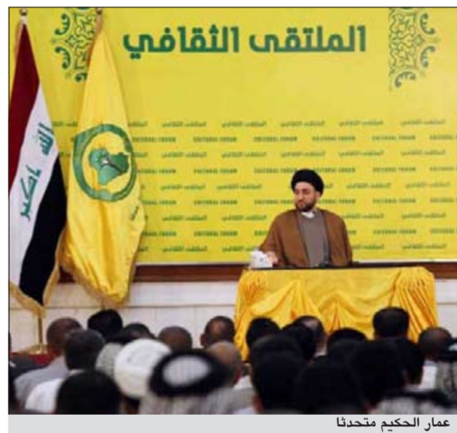
عمار الحكيم متحدثاً

بين البلدين الشقيقين. وأكد الحكيم ان المصالح المشتركة التي تجمع بين هذين البلدين هي اكبر بكثير من الاختلافات والقضايا العالقة بينهما معرباً عن امله من الاخوة والاشقاء في الكويت ان يساعدوا