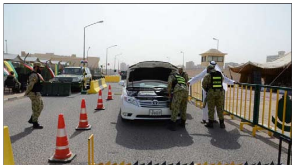
كيفية السيطرة على نقاط التفيتش

الطرق والأليات والاشخاص بهدف الحفاظ على سلامة وامن المواطنين حيث تم التدريب على كيفية السيطرة على نقاط التفيتش واستخدام الاجهزة الحديثة بكفاءة عالية. وضمن انشطة حفل التخرج نفذ ركن عمليات وتدريب وحدة التفيتش الوقائي بياناً عملياً حول اجراءات تفيتش الطرق ونقاط تفيتش المركبات حيث قام