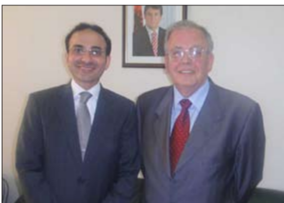
السفير نجيب البدر خلال لقائه مستشار الرئيس اللبناني

سراييفو - كونا: بحث سفيرنا لدى جمهورية البانيا نجيب البدر مع مستشار رئيس جمهورية البانيا للشؤون السياسية تشيليريم تشيباني بمقر القصر الرئاسي في العاصمة تيرانا امس عدداً من المسائل ذات الاهتمام المشترك وسبل تعزيز التعاون وتطوير العلاقات الثنائية في جميع المجالات السياسية والاستثمارية والثقافية. وأعرب البدر في تصريح لـ «كونا» عن ارتياحه تجاه مستوى التنسيق والتعاون مع المسؤولين في جمهورية البانيا.