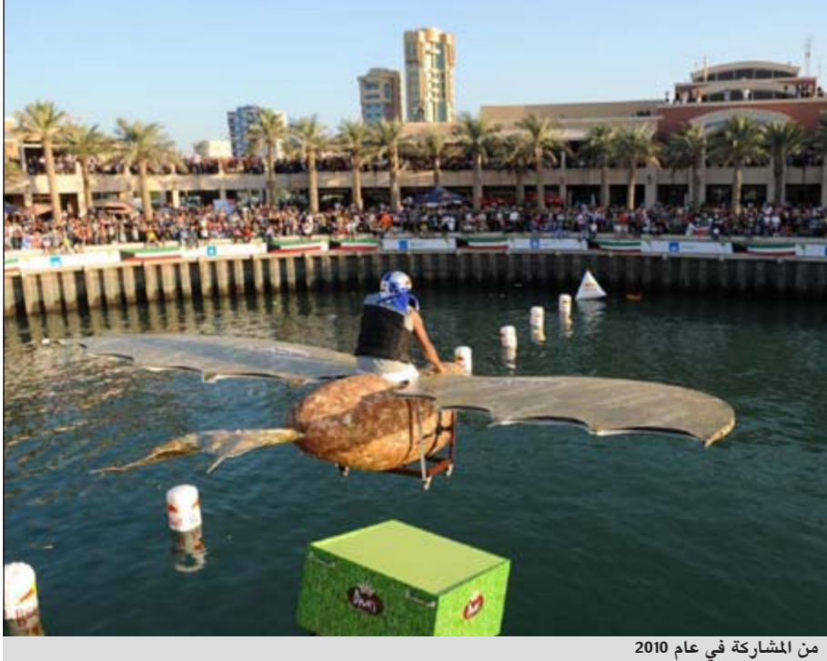
من المشاركة في عام 2010

بعدها سيقيم المستشار التقني الخاص بـ «ريد بل فلوغتاغ» بتقييم الرسومات ليختار أفضل 45 رسماً تخطيطياً. وعلى جميع الفرق التي يتم اختيارها أن تطير من مدرج بطول 30 متراً وبارتفاع 6 أمتار عن المياه، ويمكن للفرق أن تصنع مركباتها الطائرة من أي مادة بدءاً من الكرتون وصولاً إلى التيتانيوم بشرط أن تكون مستوية شروط السلامة ولكن يجب على الفرق أن تتبع مقاييس محددة بحيث أن وزن الطائرة يجب ألا يتعدى 180 كلغ مع الطيار.