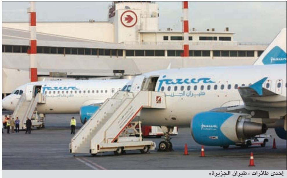
إحدى طائرات «طيران الجزيرة»

الربع الأول 2,3 مليون دينار، بزيادة نسبتها 25,5% عن الفترة ذاتها من 2011 حين سجلت 1,8 مليون دينار. هذا وبلغت الأرباح الصافية في الربع الأول 1,2 مليون دينار، بزيادة نسبتها 17,8% عن الفترة ذاتها من 2011 حين سجلت مليون دينار. كما ارتفع متوسط العائد على المقعد في الربع الأول بنسبة 20,7% مقارنة بالفترة ذاتها من 2011.