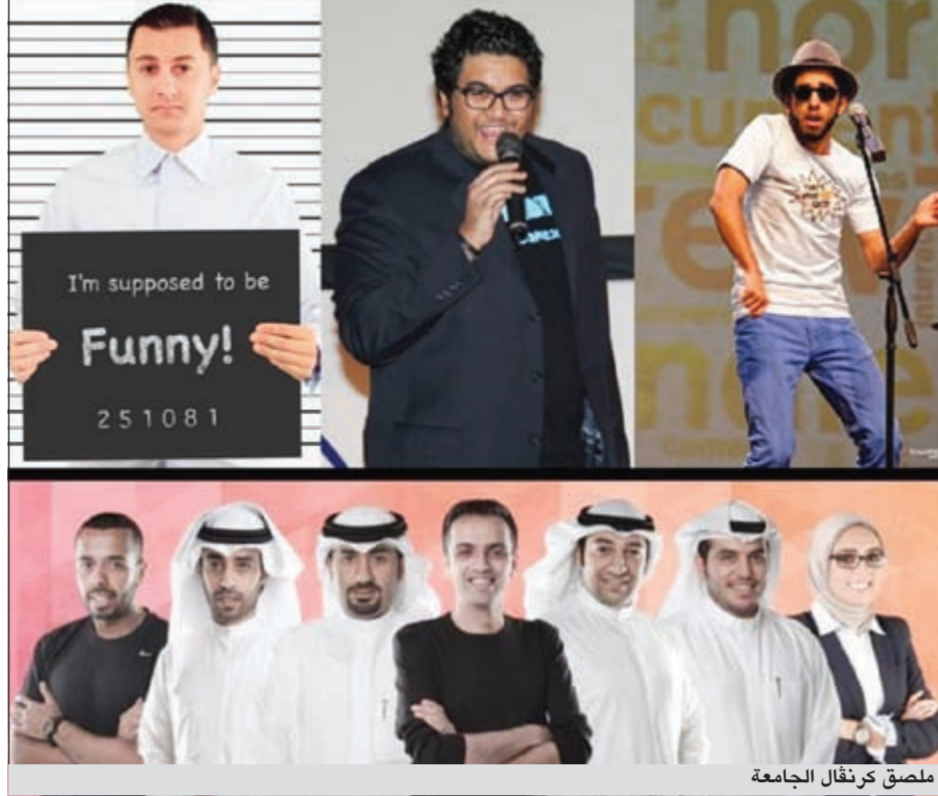
ملصق كرنفال الجامعة