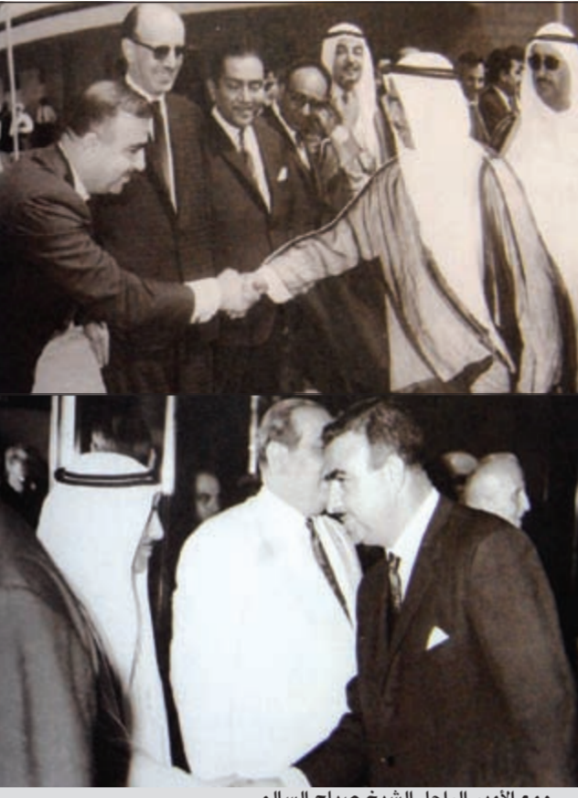
... ومع الامير الراحل الشيخ صباح السالم

بعد ربع قرن من الزمن، تملكني هاجس الحرية، حربي المصادرة فاتخذت، وساعدتني وقائع واحداث العجمان المشهورة، وكان متأثرا بالملك عبدالعزيز آل سعود ويريد اقواله دائما، وخصوصا كلمته