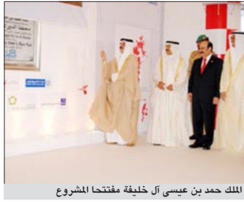
الملك حمد بن عيسى آل خليفة مفتتحا المشروع

دشن ملك البحرين الملك حمد بن عيسى آل خليفة أمس مشروع «الدور» لتوليد الطاقة وتحلية المياه والذي يعد أضخم مشروع مستقل لتوليد الكهرباء وتحلية المياه وأكبر مشروع صناعي بمملكة القطر الخاص في مملكة البحرين بتكلفة تقارب الـ 2100 مليون دولار، وهو أحد مشاريع مؤسسة الخليج للاستثمار في المملكة.