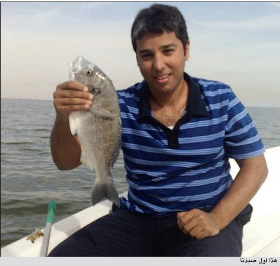
هذا أول صيدنا