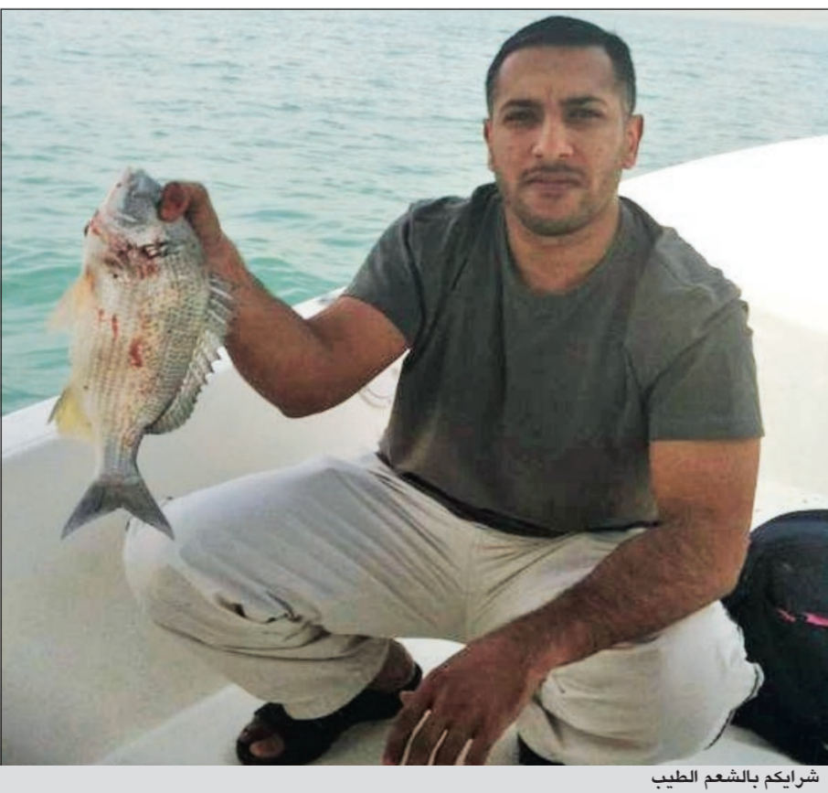
شرايكم بالشعم الطيب