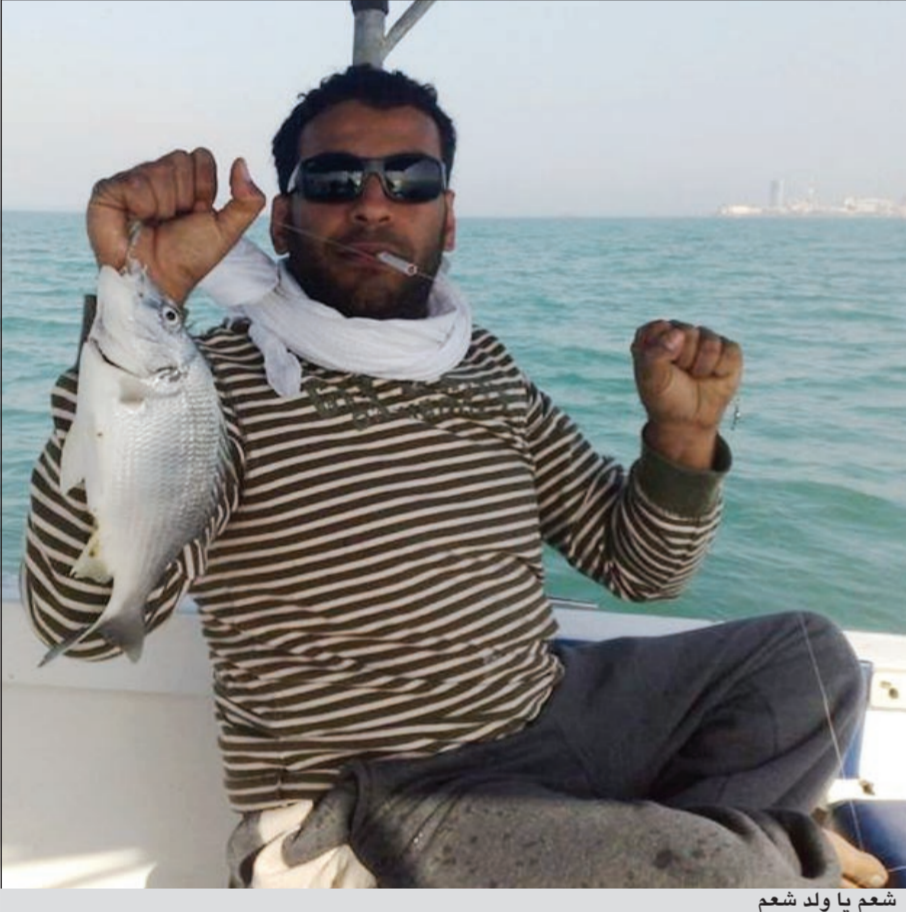
شعم يا ولد شعم

● أنا دائما أبحث عن نوعين من الاسماك ولا أتوقف أبدا عن صيدي لهما، النوع الأول وهو حبيب الملايين السبيطي وضربته على الخيط تفرز القلب، والنوع الثاني وهو ملك المائدة الهامور، وقد ساهمت القراقير والمشابك مع الأسف في في تقليل أعداد هذين النوعين يا أخي بحرنا تعب منا ومن الإهمال الذي يتسبب به البعض من اخواني الحداقة وأرجو ألا ينعلوا مني بهذا الكلام فهناك منهم من يقوم برمي العلب والأكياس الفارغة ولا يهيمه أي شيء ولا توجد عنده أي مسؤولية فلماذا هذا الفعل؟ يعني عجز الواحد انه يضع له كيسا في الطراد ويرمي كل ما يريد به وعندما يصل الي المسكة يضعه في المسكان المخصص له، معقولة هذا الشيء؟! وغيره وغيره من الأمور الكثيرة بحرنا بالنهاية نمره القراقير والمشابك والتلوث وبعض الحداقة.