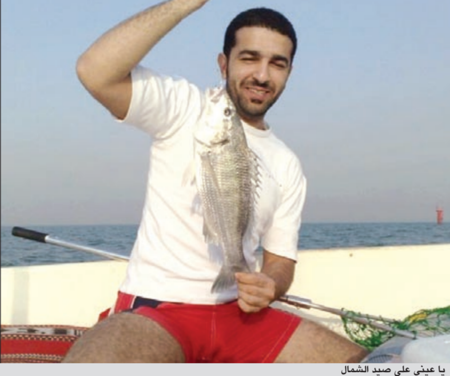
يا عيني على صيد الشمال

● اسبوعيا نسلط الضوء على هذه الهواية، ونستقبل مشاركاتكم وصوركم وآراءكم. للتواصل معنا عبر هذه الصفحة أرسلوا تعليقاتكم على الايميل: bahri@alanba.com.kw ● اعداد: هادي العنزي