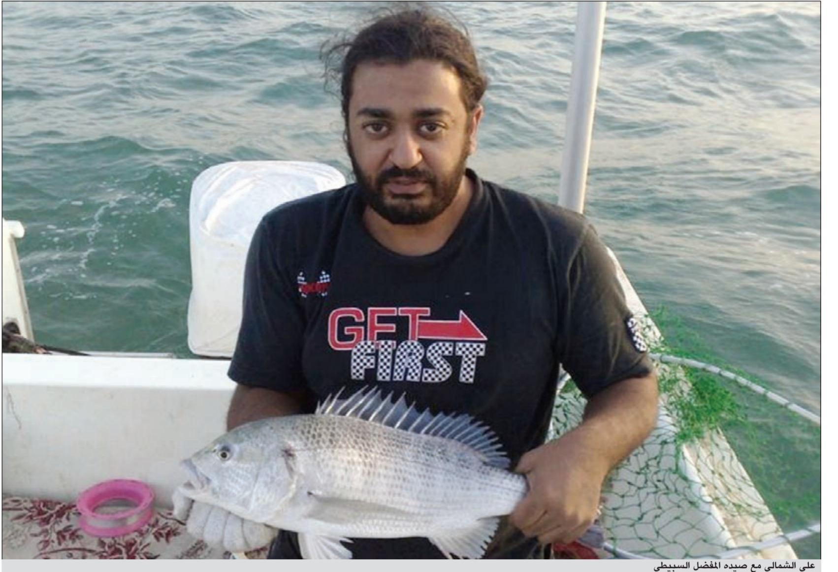
على الشمالي مع صيده المفضل السبيطي