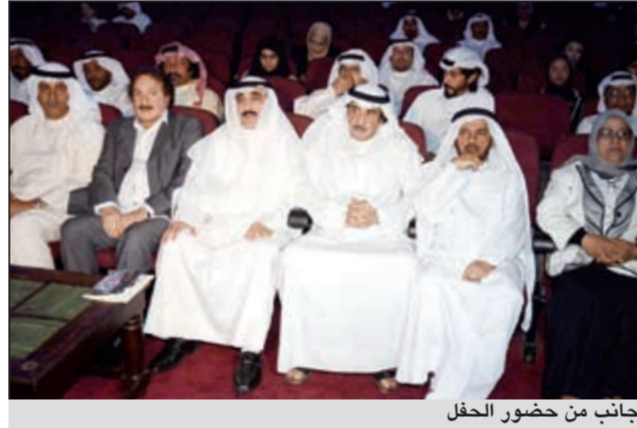
جانب من حضور الحفل