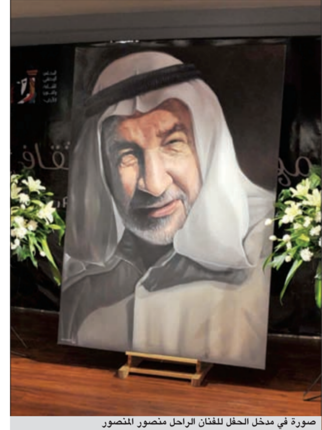
صورة في مدخل الحفل للفنان الراحل منصور المنصور