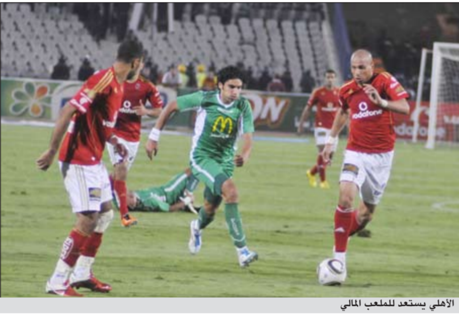
الأهلي يستعد للملعب المالي