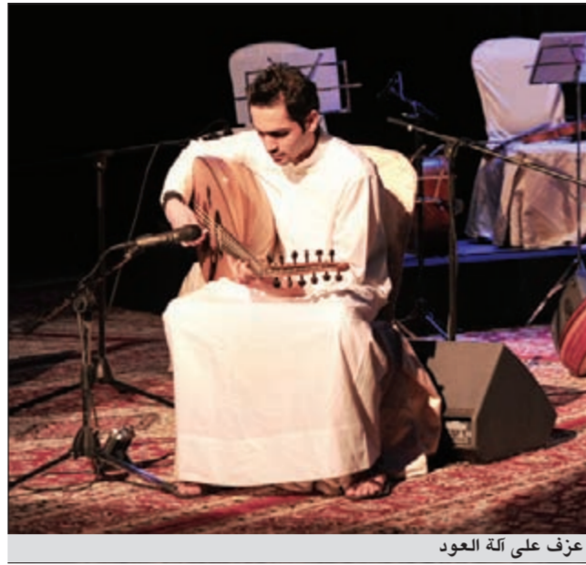
عزف على آلة العود