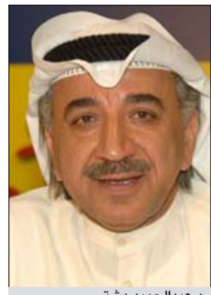
د. عبد الحميد دشتي

استغرب النائب د. عبد الحميد دشتي إثارة بعض المواضيع وتصعيد الأمور في قضية الانتصار للرسول الأكرم وآل بيته وعرضه وأزواجه، مشيراً إلى ان هذه القضية من البديهييات المسلم بها لدى جميع أبناء المجتمع الكويتي وعموم المسلمين في بقاع الأرض، فلم المرأيدة؟ وقال د. دشتي في تصريح صحافي: «دأب في الأونة الأخيرة بعض النواب وآخرون على المتاجرة لأسباب أيديولوجية أو شخصية أو لأسباب أخرى باستغلال هذه القضية وخلق حالة من الاستنفار غير المبرر محاولة