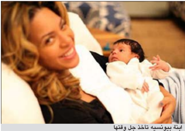
ابنة بيونسيه تاخذ جل وقتها

دي بي. سي. نت: يبدو ان ارقام الامومة حط رحاله على النجمة العالمية بيونسيه، التي كشفت انها تحولت من امرأة تركز على اناقته الى ام عادية تفضل ارتداء الاذنية المسطحة وقص شعرها بنفسها لانشغالها بمولودتها الجديدة. وقالت بيونسيه، في مقابلة اعلامية مع مجلة «بيبول»، ان الامومة جعلتها تتخلى عن احديتها عالية الكعب الشهيبة، رغم حبها الشديد لها، وازادت انها لا تملك وقتا كافيا للذهاب الى مصفف شعرها متخصص، ففضلت قص شعرها بيديها. ووضحت ان زوجها جاي زي بجدها جميلة جدا وطبيعية كلما ارتدت حذاء مسطحا وابتعدت عن مساحيق التجميل. ولفقت الى انها مرتاحة مع هذه التعديلات في طلبتها التي كانت دائما ما تكون على اكمل وجه، كما لفتت الى انها تشعر بثقة ذاتية اكثر، وانه اصبح لها هدف تصبو اليه في الحياة. واعتبرت ان ولادة ابنته هو اشبه بالحصول على ارث، وان كلمة حب