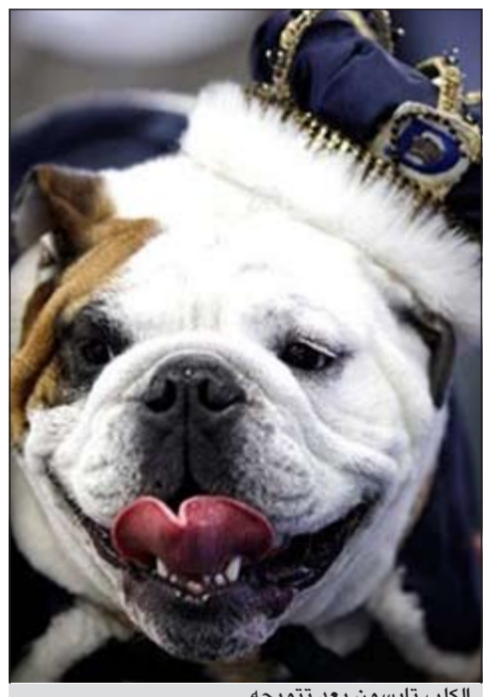
الكلب تايسون بعد تتويجه