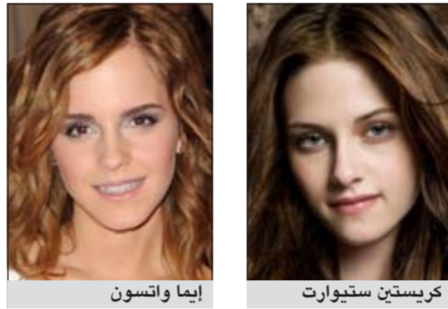
كريستين ستوارت إيماء واتسون

لندن - د.ب.ا: اعتلت الممثلة كريستين ستوارت، بطلة فيلم «توايلايت» أو «الشفق» قائمة أكثر نساء العالم أناقة لتزيح إيماء واتسون نجمة سلسلة أفلام هاري بوتر، التي حلت ثانية، من صدارة القائمة التي تصدرها مجلة «جليمور». وحلست فيكتوريا بيكام مصممة الأزياء البريطانية ومغنية فريق «سباسيا جيرلز» السابقة في المركز الثالث. كما تفوقت ستوارت على كيت ميدلتون دوقة كامبريدج التي احتلت المركز الرابع في التصويت الذي أجراه قراء مجلة «جليمور» لاختيار القائمة التي ستصدر في عدد يونيو من مجلة التي ستطرح في الأسواق الأسبوع المقبل. وجاءت المغنية فلورنس ويلش في المرتبة الخامسة والممثلة ميشيل وليامز في المرتبة السادسة، لتلتها الممثلة بلاك لايفلي في المرتبة السابعة. وتراجعت المغنية البريطانية شيريل كول من المرتبة الثانية إلى الثامنة في قائمة مجلة لعام 2012 ثم نجمة تلفزيون الواقع أوليفيا بالبرمو وأخيرا المغنية ريانا في المركز العاشر.