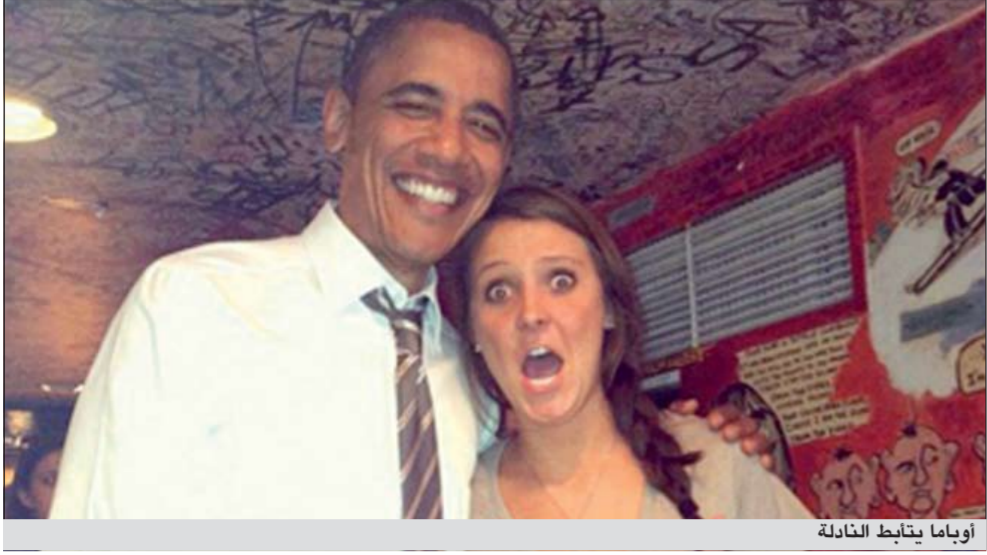
أوباما يتأبط نادلة

كانها تقول انها غير مصدقة ما يحدث. الى ذلك، اعلن البيت الابيض امس الاول ان الرئيس الاميركي باراك اوباما سيمنح أرفع وسام مدني للولايات المتحدة الى الرئيس الإسرائيلي شيمون بيريز ووزيرة الخارجية السابقة مادلين أولبرايت والمغني بوب ديلان والروائية توني موريسون. وتضم لائحة الشخصيات التي سيمنحها أوباما «الوسام الرئاسي للحرية» أيضا رائد الفضاء السابق والسيناتور جون غلين والقاضي السابق في المحكمة العليا جون بول ستيفنز، الى جانب شخصيتين توفيتا هما «مراسل الهولوكوست» البولندي يان كارسكي ومؤسسة الفرع النسائي للكشفة جوليت غوردن لاو.