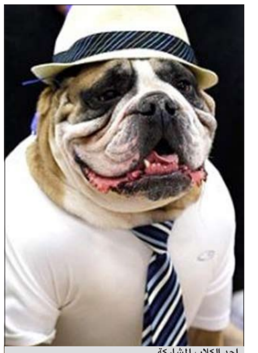
أحد الكلاب المشاركة