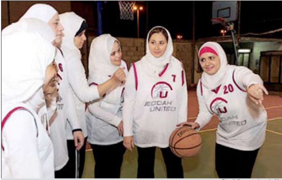
طالبات يلعبن كرة السلة

الرياض - وكالات: كشف نائب رئيس لجنة الإعلام بالاتحاد السعودي لكرة القدم أحمد المصبيح النقاب عن إنشاء مجلس استشاري لمناقشة عدد من القضايا التي تهم شريحة الشباب والفتيات في السعودية، ومنها فتح الصالات المغلقة التابعة للرئاسة أمام النساء ليمارسن فيها الرياضة وذلك بعد الاتفاق مع الجهات المعنية بهذه المسألة.