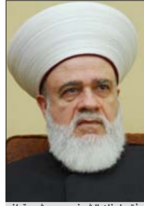
مفتي لبنان الشيخ محمد رشيد قباني

وقال رجال الدين في بيان أن التحسّر في هذه المرة يتم عبر إعداد فيلم ينشر على نطاق واسع