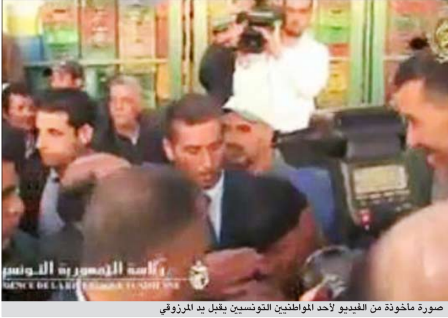
صورة مأخوذة من الفيديو لأحد المواطنين التونسيين يقبل يد المرزوقي

تونس - وكالات: فوجي الرأي العام في تونس الخميمس الماضي بانتشار فيديو على موقع التواصل الاجتماعي (فيسبوك) يبين تقبيل عدد من المواطنين ليد الرئيس المؤقت المنصف المرزوقي أثناء زيارة مفاجئة كان أداها الأربعاء لسوق مركزية بالعاصمة. ويضم الفيديو مشاهد تبرز زيارة الرئيس المؤقت لسوق الجملة بمنطقة بئر القصعة بالعاصمة والتفاف جموع من المواطنين وعدد من العاملين بالسوق حوله والهتاف بحجائه فيما احتفى البعض منهم لتقبيل يده ما مثل «صدمة» للتونسيين.