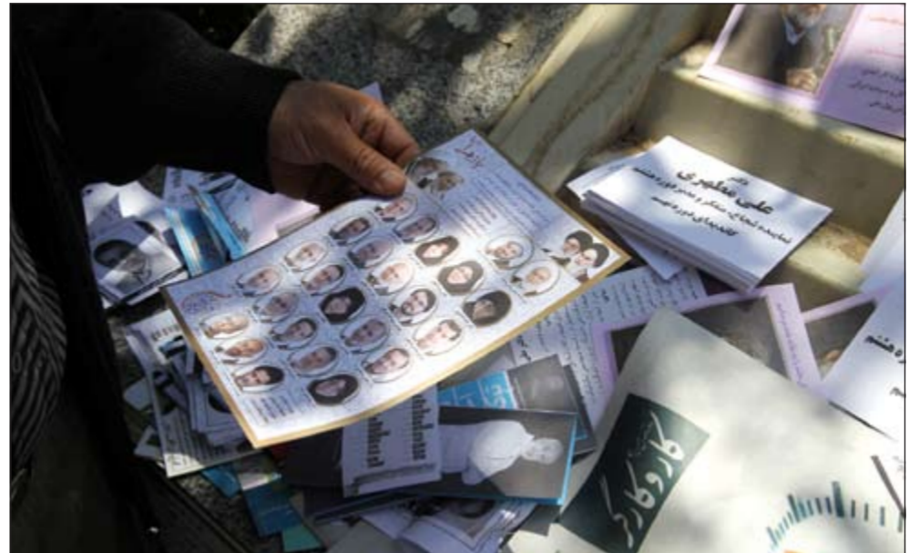
إيراني يقرأ أحد المنشورات الدعائية للانتخابات البرلمانية المقبلة

وحذر من أنه في حال حياة إيران سلاحا نوويا ستتضرر السعودية وتركيا ومصر للانضمام لسباق تسلح نووي. ونقلت صحف إسرائيلية اسم عن باراك في حفل استقبال لقيادة جهاز الأمن الإسرائيلي بمناسبة «يوم استقلال» إسرائيل أمس الأول إن القيادة الإيرانية «ليست عقلانية بالمفهوم الغربي للكلمة» وذلك خلافا لما كان غانتس قاله لصحيفة «هانتس» الأربعاء إنه يعتقد «أن القيادة الإيرانية مؤلفة من أشخاص عقلانيين جدا» مستبعدا «أن تقرر إيران صنع قنبلة نووية». لكن غانتس حذر في الوقت نفسه من أن قنبلة نووية بأيدي إيران تشكل خطرا وجوديا على إسرائيل التي ستعمل على منع ذلك. وقال باراك إن «حقيقة أن الحديث يدور عن أشخاص أذكاء ويفكرون ويتطلعون إلى البقاء في الحكم ويسعون نحو أهدافهم بمكر غير محسود ومن خلال تقدير متواصل لخطوات ونوايا الخصم لا تجعلهم عقلانيين