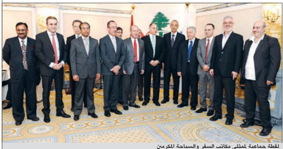
لقطة جماعية لممثلي مكاتب السفر والسياحة المكرمين

وأكد على ان اسطول الشركة يعد الاحدث والاصغر عمرا في المنطقة، وهو ما يعزز السفر على متن الخطوط اللبنانية. وعبر القادي في حديث خاص لـ «الانباء» عن ان الشركة حققت معدل مبيعات يفوق نسبته نحو 100% في الربع الاول من العام الحالي، وذلك مقارنة بالربع الاول من العام الماضي، والذي أتمم بوجود بعد الاضطرابات في لبنان. وتوقع ان تستمر الشركة في تحقيق معدلات زيادة في حجم مبيعاتها من التذاكر خلال العام الحالي. وقال ان الشركة تتيج تذاكر بأسعار متباعدة بين 49 ديناراً و330 ديناراً لتلائم جميع شرائح المجتمع، وهو الامر الذي يعزز السفر على متن خطوط الشركة، ويجعلها في موقع وقاية من المنافسة المحلية والإقليمية. وأشار إلى ان الشركة تدعم أسعار تذكر السفر عبر دعم الزيادة في أسعار وقود الطائرات عالمياً، حيث يتم احتساب كلفة أسعار النفط عند 60 دولار للبرميل، وذلك رغم انها زادت بنسبة أكثر من 100%.