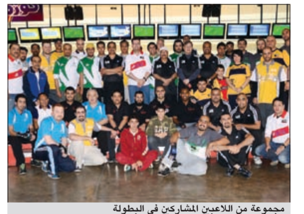
مجموعة من اللاعبين المشاركين في البطولة

تنتقل في الرابعة عصر اليوم على صالة كوزمو بالسالمية مسابقة الاساتذة (الماستر) لبطولة دوري بولينغ نادي مصارف الكويت والتي ينظمها النادي لموظفي القطاع المصرفي ويشارك فيها 90 لاعبا ولاعبة من موظفي البنوك الأعضاء في النادي والذين تاهل منهم 16 لاعبا ولاعبة لمسابقة الاساتذة. وقد رصدت ادارة نادي المصارف جوائز قيمة للفائزين بالمراكز المتقدمة.