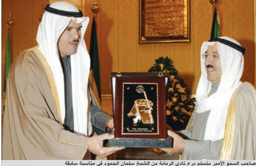
صاحب السمو الأمير يتسلم درع نادي الرماية من الشيخ سلمان الحمود في مناسبة سابقة