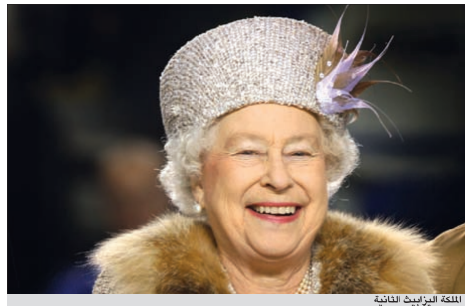
الملكة إليزابيث الثانية

وتوجه مباشرة لمسيحيي بريطانيا بالقول: «أنقذوا أنفسكم وأبناءكم بهذه الحياة الدنيا من المعاناة والقيود عندها فقط تستطيعون ضمان أنفسكم في الحياة القادمة ما بعد الممات».