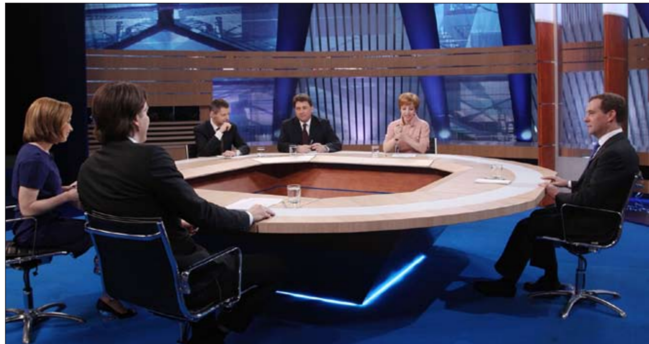
الرئيس الروسي ديميتري مدقيديف خلال مقابلة مع المحطات الروسية

في مايو المقبل في مدينة شيكاغو الأمريكية وأكسد في التدريبات البحرية الروسية - الصينية المشتركة الجارية في البحر الأصفر غير موجه ضد أي بلد آخر. في هذا الوقت قال رئيس جمهورية كازاخستان نور سلطان نزارباييف أمس الأول إنه يمكن لبيلاروس وروسيا وبيلاروس (روسيا البيضاء) أن تشكل اتحادا أفضل من الاتحاد الأوروبي إذا أخذت في الاعتبار أوجه النقص والإخفاق. وقال نزارباييف في مقابلة مع قناة «روسيا 24»: «أوروبا تواجه أوقاتا عصيبة، نعرفها، نراها. ولكن علينا أن نتذكر أنها دخلت في اتحاد منذ أكثر من 60 عاما، منذ ستينيات القرن الماضي وأنها استطاعت أن تقيم روابط قوية لا يمكن كسرها بسهولة». ورأى نزارباييف أن كازاخستان وبيلاروس وروسيا تتمتع بمزايا تحقيق الرفاهية، ليس على حساب البيوت كما يحدث في أوروبا «ولذلك ليس هناك حاجة تدعو لخفض الأجور ومعاشات التقاعد».