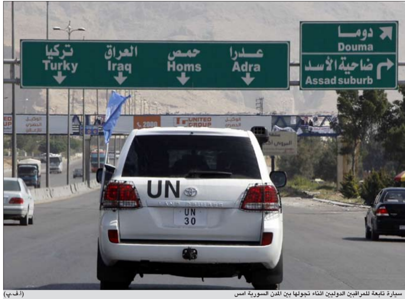
سيارة تابعة للمراقبين الدوليين أثناء تجولها بين المدن السورية أمس

وفي محافظة دير الزور (شرق)، قتل عدد من المواطنين اثر اطلاق نار من رشاشات ثقيلة وسقوط قذائف هاون على قرية موحسن من قبل القوات النظامية التي تحاول اقتحامها. بحسب المرصد. وشهدت مناطق في درعا (جنوب) انتشارا أمنيا كثيفا فيما سمعت اصوات اطلاق نار كثيف من الرشاشات الثقيلة في مدينة داعل، وفقا للجان التنسيق. من جهة أخرى، قالت وكالة سانا السورية الرسمية ان «مجموعات إرهابية مسلحة» قتلت مدير مدرسة في حلب بتفجير سيارته «في إطار استفادتها للكفالات الوطنية». وقالت أيضا ان «مجموعات إرهابية مسلحة» قتلت اربعة مواطنين من عائلة واحدة في عربين بريف دمشق. بدوره اتهم وزير الإعلام السوري عدنان محمود أمس «المجموعات الإرهابية المسلحة» بارتكاب أكثر من 1300 خرق لوقف إطلاق النار الذي دخل حيز التنفيذ في الثاني عشر من أبريل. إلى ذلك، اتهمت وزارة الخارجية الروسية المعارضة السورية أمس باللجوء إلى «تكتيك الإرهاب» الذي يذكر بالوسائل التي تستخدمها القاعدة، واعتبرت المعارضة مسؤولين عن القسمة الأكبر من انتهاكات وقف إطلاق النار. وقال الناطق باسم الوزارة