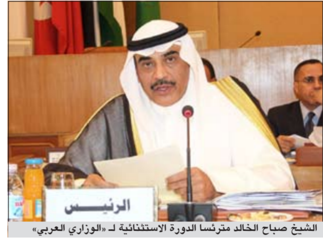
الشيخ صباح الخالد يترأس الدورة الاستثنائية لـ «الوزاري العربي»

القاهرة - كونا: انطلقت أمس أعمال الدورة الاستثنائية لمجلس جامعة الدول العربية على مستوى وزراء الخارجية العرب برئاسة نائب رئيس مجلس الوزراء ووزير الخارجية ووزير الدولة لشؤون مجلس الوزراء الشيخ صباح الخالد لبحث تطورات الملف السوري والموقف على الحدود بين دولتي السودان وقضية الجزر الإماراتية. أكد الشيخ صباح الخالد في كلمته في افتتاح الجلسة أن هذه الدورة الاستثنائية لمجلس الجامعة العربية تعكس اهتمام الجامعة بما يحيط بالدول الأعضاء من مخاطر وعواصف تهدد ليس كيان هذه الدول وحدها وإنما مجمل الأمن القومي العربي. وأشار إلى أن هذا الأمر «يتطلب منا جميعاً التمعن في قراءة هذه التطورات وأن تكون جاهزين للتعاطي معها على قاعدة احترام الالتزامات والتعهدات العربية المشتركة طبقاً لميثاق جامعة الدول العربية وقراراتها». وقال إن جدول أعمال الدورة غير العادية يتضمن ثلاثة بنود مهمة وعاجلة مطروحة على المجلس أولها تطورات الأوضاع بين جمهورية السودان وجمهورية جنوب