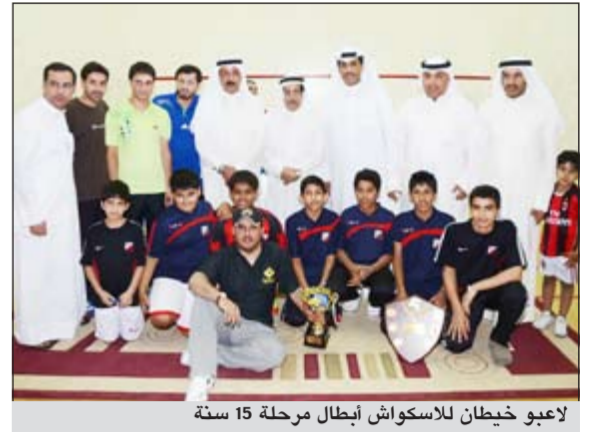
لاعبو خيطان للإسكواش أبطال مرحلة 15 سنة

حدد اتحاد الإسكواش الثامن من شهر مايو المقبل موعداً لانطلاق بطولة الكويت المفتوحة (بطولة صباح سالم الصباح سابقاً) وكان الاتحاد أقام مساء أمس الأول على مركز نادي خيطان للإسكواش حفلاً بمناسبة ختام مسابقات الدوري العام والكأس للموسم الحالي. وتم توزيع الدروع والكؤوس على الأندية الفائزة بالمرکز الثلاثة الأولى لكل مرحلة سنوية وأسفرت نتائج الدوري العام لمرحلة 11 سنة عن فوز خيطان بالمرکز الأول وتلاه الكويت بالمرکز الثاني ثم العربي بالمرکز الثالث، وتوج العربي باللقب بمرحلة 13 سنة وتلاه كاظمة بالمرکز الثاني والكويت بالمرکز الثالث. وحظف لاعبو خيطان لقب مرحلة 15 سنة وتاهم الكويت ثانيًا ثم العربي ثالثًا وتفوق اليرموك في مرحلة 17 سنة وتلاه الكويت في المركز الثاني والسالمية بالمرکز الثالث ولم يتنازل اليرموك عن لقب مرحلة 19 سنة وحصل لاعبه على المركز الأول وتاهم فريق القادسية بالمرکز الثاني ثم السالمية بالمرکز الثالث. وتابع اليرموك تألقه في مرحلة السن العام وحقق المركز الأول وتلاه السالمية ثانيًا والكويت ثالثًا. أما في بطولة كأس الاتحاد فقد بقي خيطان مسيطراً على المرحلة 11 سنة وتوج بلقبها وتلاه فريق القرنين بالمرکز الثاني والكويت بالمرکز الثالث وفي مرحلة 13 سنة جاء العربي بالمرکز الأول وتلاه كاظمة بالثاني ثم خيطان بالمرکز الثالث وبقي خيطان مهيمًا على منافسات مرحلة الـ 15 سنة وحقق المركز الأول وتلاه الكويت بالمرکز الثاني والسالمية ثالثًا والحال نفسه في مرحلة 17 سنة التي حقق لقبها اليرموك وتلاه الكويت ثانيًا ثم خيطان ثالثًا وفي مرحلة 19 سنة حقق اليرموك المركز الأول والقادسية الثاني وكاظمة الثالث وتوج اليرموك أيضاً بلقب السن العام وتلاه السالمية بالمرکز الثاني والكويت بالمرکز الثالث.