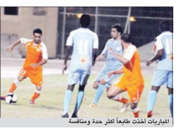
المباريات أخذت طابعاً أكثر حدة ومناقشة

تشهد بداية الجولة الرابعة عشرة لدوري فيفا البحرين للدرجة الأولى مباراة واحدة اليوم في صراع الهروب من المؤخرة وضمان منطقة الوسط بعد أن اشتد الصراع بين الفرق وتقارب النقاط بينهما. ونظراً لتأجيل مباريات الجولة 13 ليوم واحد بسبب إقامة الفورمولا 1 فقد تأجلت مباراة النجمة والبيسيتين لتقام غدا الجمعة، فيما يلتقي اليوم الأهلي القابع لوجده في المؤخرة برصيد 11 نقطة مع البحرين برصيد 14 نقطة صاحب المركز الثامن. ويلتقي غدا الرفاع الشرقي برصيد 14 نقطة مع المحرق المتطلع مواصلة الصعود على النجمة بعد الخسارة أمام المنامة في الأسبوع الـ 13 والبريد 28 نقطة، فيما يلتقي البيسيتين الخاسر من النجمة برعاية ورسيدته 22 نقطة مع المنامة المنتهني بالفوز على المحرق ورسيدته 17 نقطة متساويا مع الحد بنفس الرصيد والذي سيقتابل المتصدر الرفاع ورسيدته 32 نقطة بعد تعادله مع الحالة 2-2. ويلتقي النجمة برصيد 15 نقطة مع الحالة برصيد 14. لذلك فإن المرحلة القادمة ستكون فرصة لجمع النقاط في محاولات للهروب من المؤخرة ويبقى الصراع قائماً بين الرفاع والمحرق.