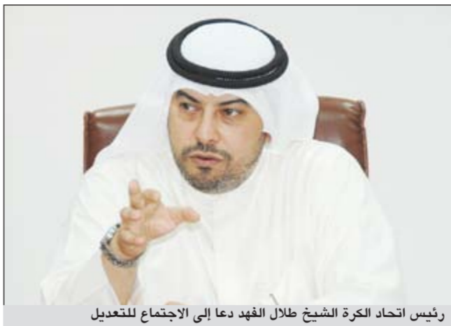
رئيس اتحاد الكرة الشيخ طلال الفهد دعا إلى الاجتماع للتعديل

يحل نجم العربي والمنتخب الوطني لكرة القدم علي مقصيد في الساعة الـ 10:25 مساء اليوم ضيفاً في برنامج «ستار تايم» في القناة الثالثة الرياضية للمذيع المئاتق عبدالعزیز النبهان، حيث يتحدث مقصيد عن جوانب كثيرة من حياته اليومية والرياضية ويفجر عددا من المفاجآت التي تستحق المشاهدة للمرة الأولى.